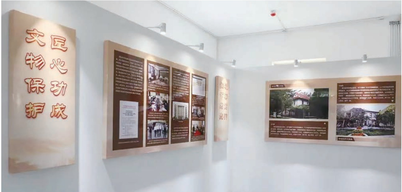
“潍县西方侨民集中营旧址修缮保护工程成果展”展厅