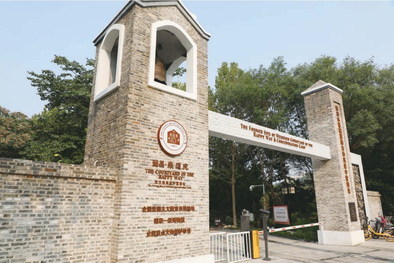
修葺后的乐道院潍县集中营博物馆主入口