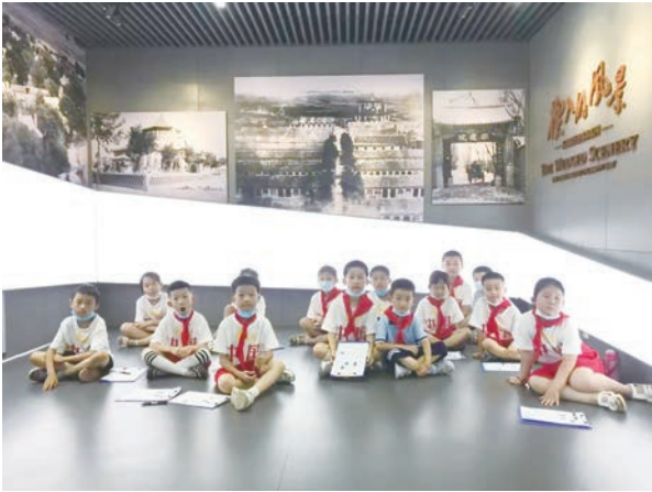
潍坊明德学校学生参加博物馆组织的“请党放心 强国有我”研学活动