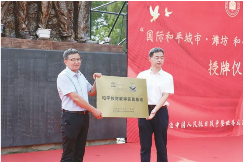
潍坊广文中学被授予“国际和平城市·潍坊 和平教育实践教学基地”