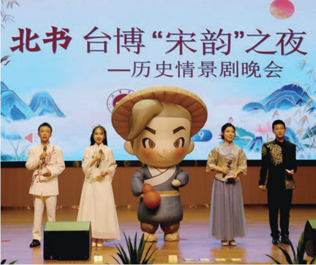
台博文创“台博君”于晚会现场与观众互动

始尝试实践戏剧教育，但是更多的还是以单场戏剧表演为主。“首届星光国潮儿童戏剧节”一共举办了两天，孩子们展演了13个剧本，既有连续性，又氛围十足。浙江省博物馆研学专委会郑雅评价道：“‘戏剧节’理念做得很好，和浙江文旅厅倡导‘文艺星火赋美’的理念如出一辙。”台博打造“戏剧节”教育项目，不求规模，旨在“赋美”，队伍多数为三五人组成，以小分队、常态化的展演形式，以求该项目的延续，以期实现以博物馆力量为青少年赋美。