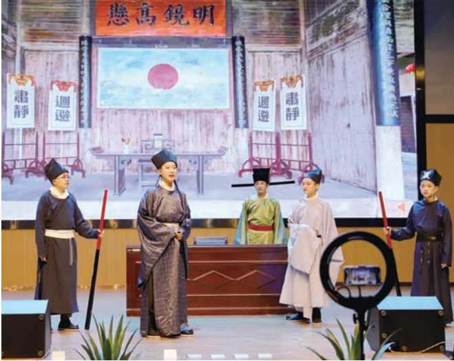
历史情景剧晚会演出现场

文艺不限于剧场，不囿于围墙。在当下文化润富的时代大潮中，文艺、美育成为丰富人民精神生活的重要组成部分。文艺赋美，需要薪火相传后继有人，需要从娃娃抓起，而博物馆在青少年群体中拥有天然优势。台州博物馆（以下简称“台博”）是一座年轻又充满活力的综合性博物馆，秉承“守正创新”的发展理念，致力探索实践如何创新传播形式、发挥博物馆力量，如何更好服务社会、服务青少年。