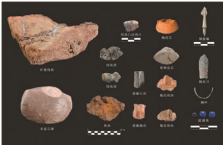
铜器、冶炼遗物及石器