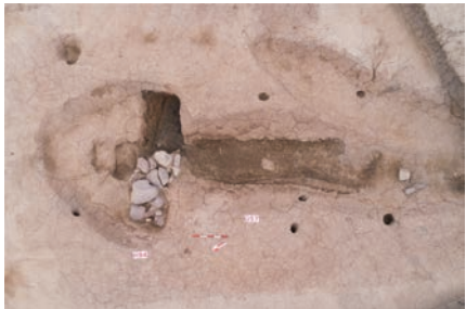
H94 与 G57

官田遗址位于湖南省张家界市桑植县澧源镇朱家坪村，地处郁水河西岸一处较为宽阔的台地，面积约 75000 平方米。2015 年首次发掘 550 平方米，发掘显示官田遗址应存在生铁铸造活动。2020 年至 2022 年，为配合地方建设，湖南省文物考古研究院联合四川大学考古文博学院、北京大学考古文博学院等单位对官田遗址再次进行考古发掘，揭露面积 3500 平方米。