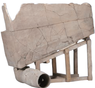
2022SYY 三号建筑 F2 晚期陶便器与弯管组合情况

秦汉栎阳城，位于陕西省西安市阎良区新兴、武屯街道。据文献记载，栎阳自秦献公二年迁都栎阳（前 383 年），到孝公十一年迁都咸阳为秦都 34 年，其间秦人再次开展了一系列深刻的社会变革。秦末楚汉，栎阳先为塞王司马欣之都，后为汉王刘邦之都。汉初刘邦先以栎阳为都，后高祖七年“长乐宫成，自栎阳徙长安”，栎阳是大汉王朝的第一个都城。