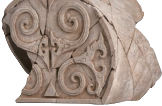
三号建筑东北出土大半圆瓦当