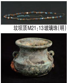
坟坝顶 M21:13 玻璃珠（明）