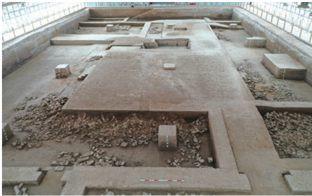
三号建筑清理中（东-西）

十一号建筑，位于发掘区东侧，通过北侧廊道西折后与十号建筑连接。台基呈长方形，东西长 21.3、南北宽 16.8，残高约 0.55～0.7 米，面积 357.84 平方米。台基南侧的东西方向各设一