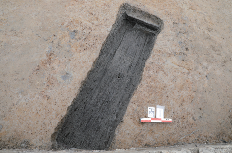
南山遗址H27及其外围木板