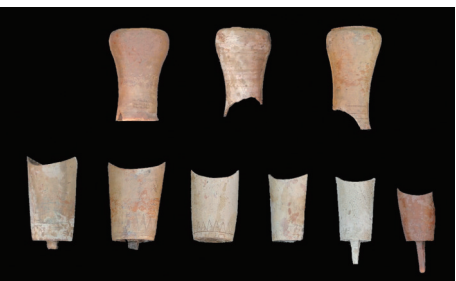
出土原始瓷罇于和句罐