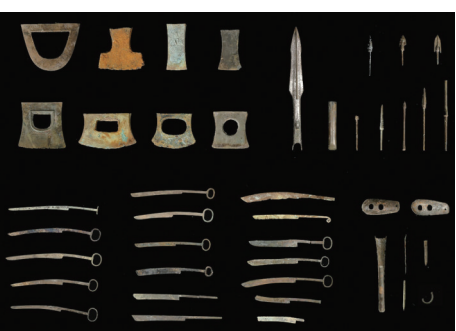
出土青铜工具和兵器