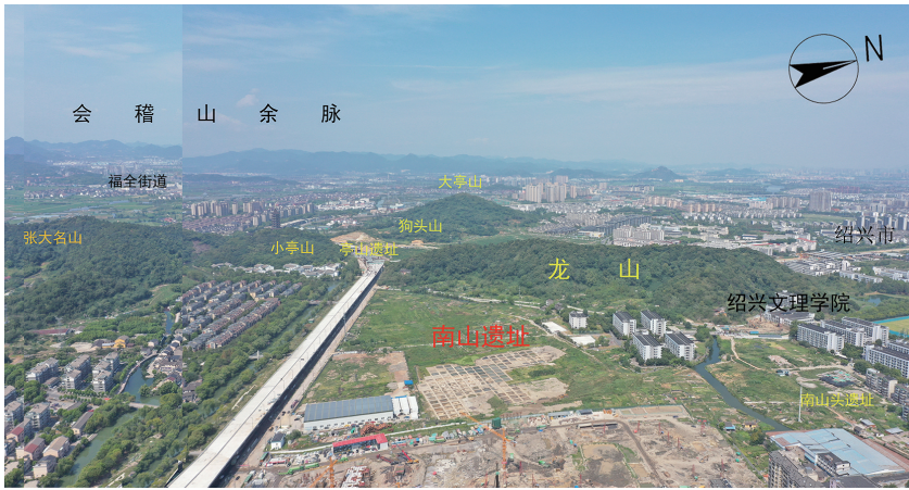
南山遗址及周边地形航拍

南山遗址位于绍兴市越城区城南街道南山村,地处会稽山北麓,龙尾山东南侧,坡塘江西侧,因绍兴市G8地块建设,2021年起,由浙江省文物考古研究所联合绍兴市文物考古研究所、越城区文物保护所进行考古发掘。