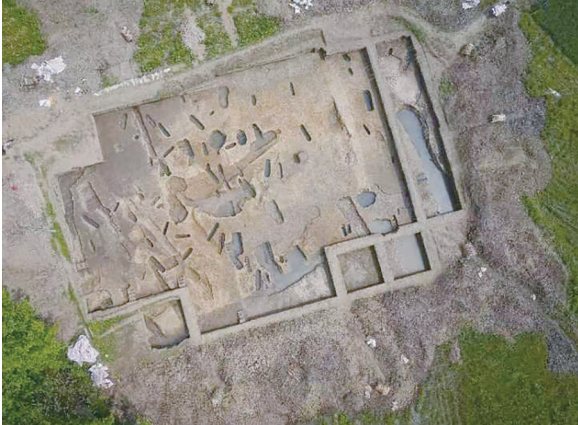
成都平原史前城址——高山古城遗址