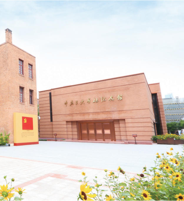
中共三大会址纪念馆

“点燃理想之光”青少年研学课程是中共三大会址纪念馆基于馆校合作、充分利用纪念馆资源开展青少年综合性实践学习而开发的系列研学课程。课程将优秀的革命传统进行系统与创新教育,引导少先队员继承弘扬革命传统,开创青少年德育课程新思路。该课程获广州市教育局《利用爱国主义教育基地研发教学课程资源课题》立项,于2021年3月结题入选广州市馆校研学系列教材;于2021年建党百年及中共三大会址纪念馆重新开放之际正式实施;截至今年5月已开展研学活动(含线上)29场共24.3万人次参加,取得了良好的社会反响与积极的社会效应。