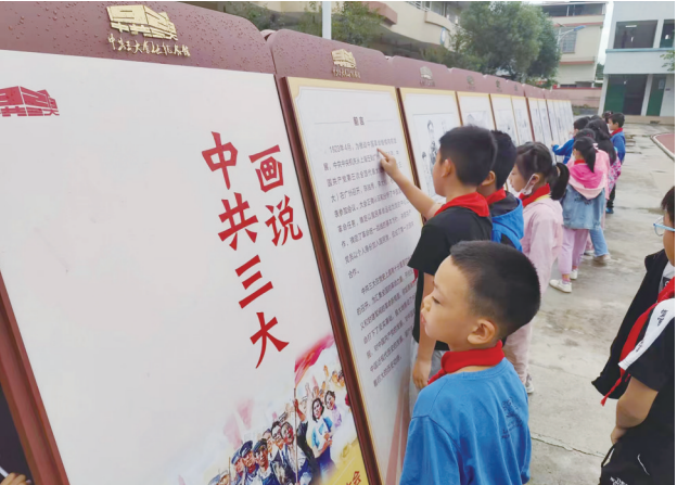
“三大百年”百场巡展