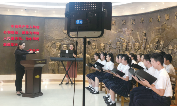
中共三大主题实景课堂《国际歌》慕课

为恤孤院后街31号,是一栋金字瓦顶的两层民居,1938年被日军飞机炸毁,原址的平房是新中国成立后新建的。1979年,中共三大会址被公布为广东省文物保护单位,并划定保护范围予以控制性保护。