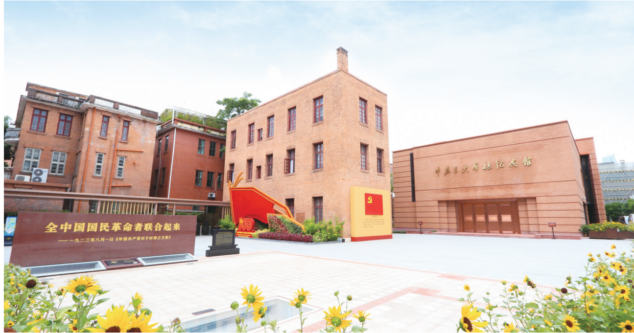
中共三大会址纪念馆

以革命事件、革命文物、革命文献、革命人物为核心,深入研究,做好基本陈列和相关展览。 中共三大作为党代会类型的革命事件,包括历史背景、会议过程与成果、历史影响与意义等,都是中共三大红色资源最核心的内容,构成了基本陈列大纲框架。马林的会议笔记和给共产国际的报告,以及中共三大代表等相关人员的记录或回忆,是反映会议情况的重要资料。中共三大的革命文物主要是指中共三大遗址、中共中央机关旧址春园。20世纪70年代的会址专项调查,2006年的会址考古勘察与复原研究,2021年的会址研究新发现,为中