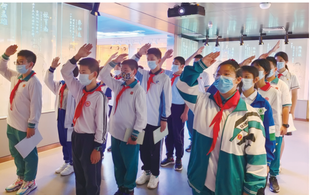
“点燃理想之光”青少年主题研学