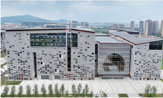
浙江省博物馆之江馆

之江馆区陈列展览及公共服务空间位于地下一层至地上四层，展览策划以“思想高度、学术深度、人文温度”为原则，构建了“159”多样化的展览体系，即1个浙江通史展、5个浙江文化专题展、9个功能拓展体验展。“浙江一万年”通史陈列将浙江万件大事记以“之”字形依次展开，用考古成果和文物突出浙江历史的高光亮点，以及稻作、丝绸、瓷器等起源，体现浙江人文和科技发展对中华文明乃至世界文明的贡献；青瓷、海洋、宋韵、书画、名人等5个浙江文化专题陈