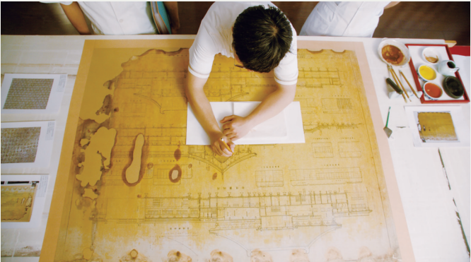
文物保护修复工作照