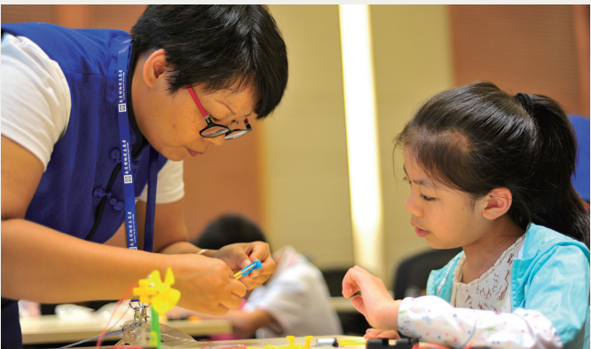
志愿者辅助社教活动的开展