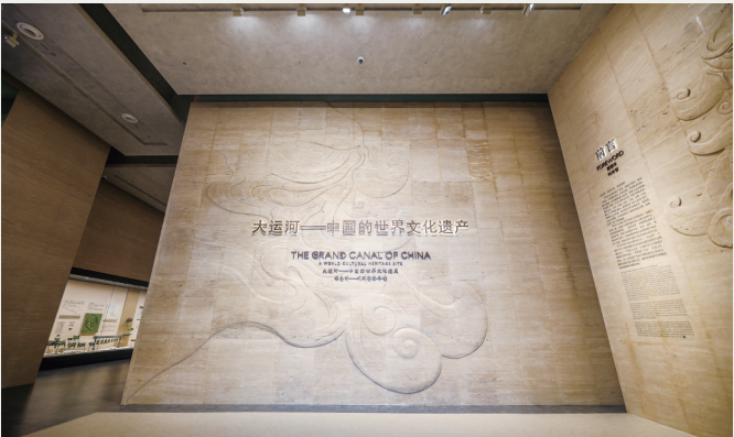
“大运河——中国的世界文化遗产”展览