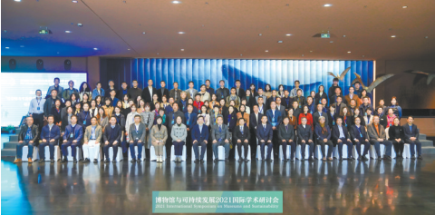
博物馆与可持续发展2021国际学术研讨会合影