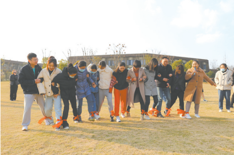
开展“1+X”趣味运动会，团结党群关系