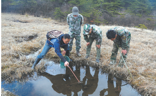
浙江自然博物院科研人员野外参与安吉小鲵的研究保护工作