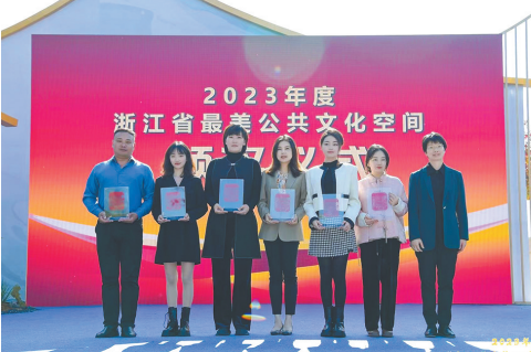
浙江自然博物院安吉馆荣获2023年度“浙江省最美公共文化空间”最佳示范奖