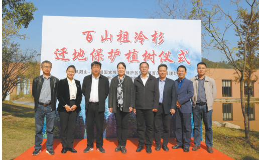
百山祖冷杉迁地保护植树仪式在安吉馆举行