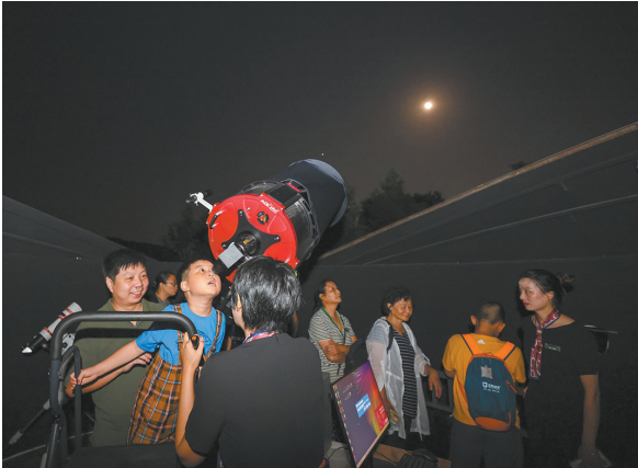
观众参与中秋天文观月活动

先后举办多场重要学术会议，2019年组织召开“当代博物馆创新发展学术研讨会”，2021年组织召开“博物馆与可持续发展2021国际学术研讨会”等，通过学术研讨会，交流中外博物馆研究的最新成果，研讨学术前沿的新理念、新方法，分享博物馆发展面临的机遇挑战及其对策。