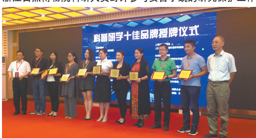
科普研学十佳品牌授牌仪式