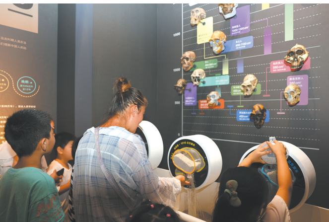
观众体验“人类的奥秘”展览互动装置

践行“两山”理念，举办系列弘扬生态文明建设展 浙江安吉是“两山”理念诞生地、践行地和样板地，安吉馆在建设之初，即高举“两山”理念大旗，做好生态文明建设的文章，做“两山”理念的传播者、实践者。在“两山”理念诞生14周年之际，推出了“绿水青山就是金山银山——从余村出发的生态文明践行”特展，全方位展示了浙江及中国在生态文明建设方面所做出的努力与成果，对“两山”理念的宣传起到了很好的推动作用，特展获国家文物局2019年度“弘扬中华优秀传统文化、培育社会主义核心价值观”主题展览重点推介项目之一。此外，多次举办“严守国门安全 共护绿水青山”等科普展，展示我国在生态文明建设中取得的成就，推动“两山”理念的传播。