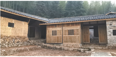
龙英红三军团指挥所旧址修复后

保护单位。目前，抚州的革命文物有全国重点文物保护单位2处，即乐安和金溪的中央苏区第四次反“围剿”遗址和黎川的湖坊中共闽赣省委、省革委、省军区旧址；省级文物保护单位29处，市、县级文物保护单位277处，一般文物297处。