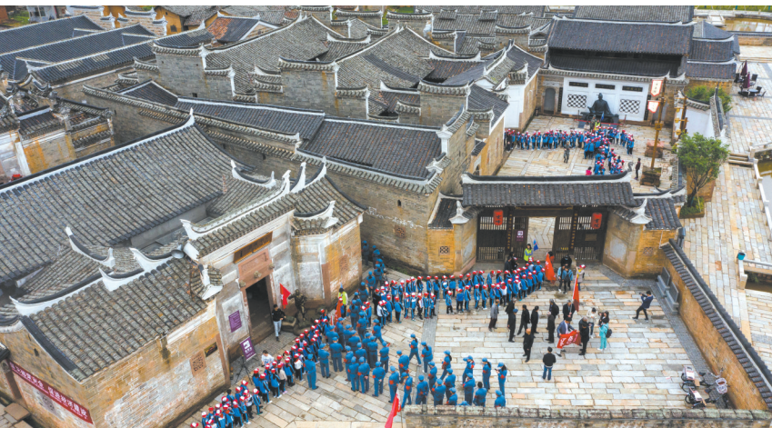
广昌饶家堡红一军团前线指挥部旧址（雯峰书院）革命教育活动