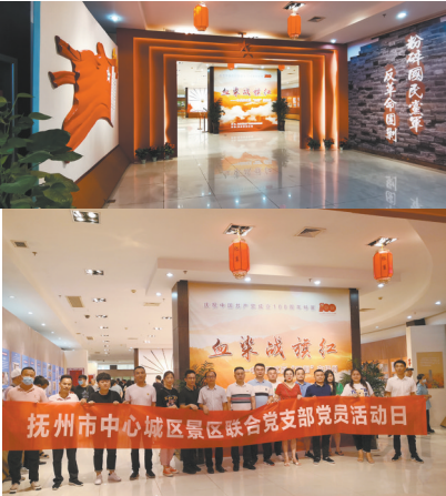
血染战旗红——中央苏区反“围剿”在抚州

三是流动展览“六进”。抚州市博物馆精心设计了“峥嵘岁月读初心——发生在抚州红土地上的革命故事”“血染战旗红——中央苏区反‘围剿’在抚州”“学史明理——抚州的红色政权建设”等图文并茂的流动展览，深入机关、社区、学校、军营、企业、景区等地开展红色文化宣传教育。先后在市县乡镇20余所大中小学，10余个企事业单位、文化广场等地展出。