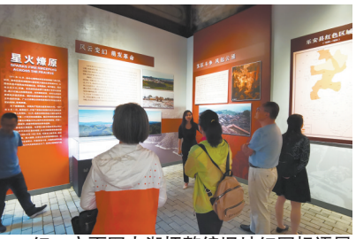
红一方面军大湖坪整编旧址红军标语展

2020年，乐安县投入3000余万元在大湖坪整编旧址设立以红军标语为主题的博物馆，并被列为中国井冈山干部学院现场教学点，该馆以“墙上的号角——见证初心的红色标语”为主题的 basic 陈列荣获江西省博物馆（2018—2019年度）十大精品陈列展览精品奖。让红军标语“活”起来——乐安县“红军标语+全社会力量”保护利用模式入选2020全国革命文物保护利用十佳案例。