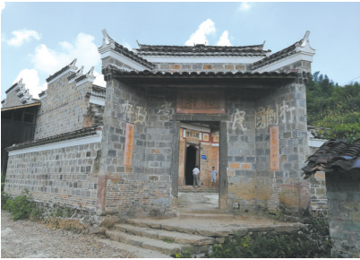
磁圭红三军团指挥部旧址前院门楼