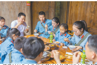
后龚村红色文化教育基地社教活动“吃红军餐”

加强革命文物保护利用，弘扬革命文化，传承红色基因，是党全社会的共同责任。抚州将继续统筹做好保护、管理、利用各项工作，推动革命文物工作开创新局面，奋力走好新时代长征路。