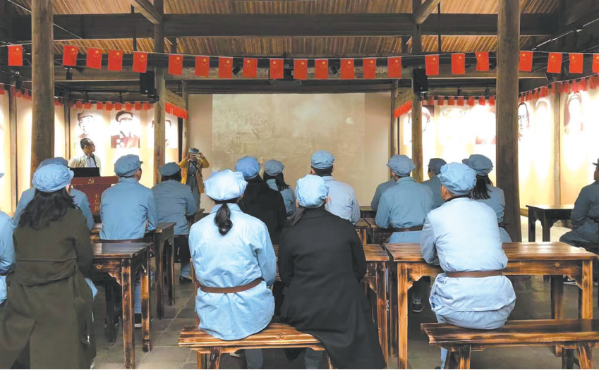
抚州市直文博系统在红色教育基地金溪后龚接受革命传统教育