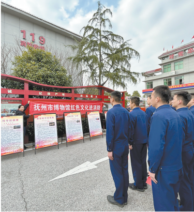
红色文化宣讲走进消防队