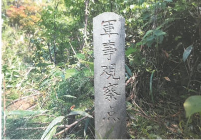
建黎泰战役军事观察点碑