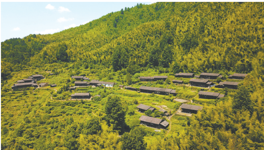
姚家岭资贵红军游击根据地旧址

抚州是中央苏区的屏障，是连接赣东北苏区的战略要地，在此红军与国民党发生无数次战斗，仅第五次反“围剿”中，中央红军共开展了22次大的战役战斗，其中18次发生在抚州境内。毛泽东、朱德、周恩来、邓小平等老一辈无产阶级革命家带领中央红军在这里进行了长时间的革命实践。广昌战役，黄陂战役等遗留的工事、战壕、烈士墓群，为我们怀念当年血与火的革命岁月提供了宝贵的实证；康都毛泽东旧居、后龚周恩来旧居、严坑朱德旧居、港下邓小平旧居等红色革命旧址、遗址是我们追寻