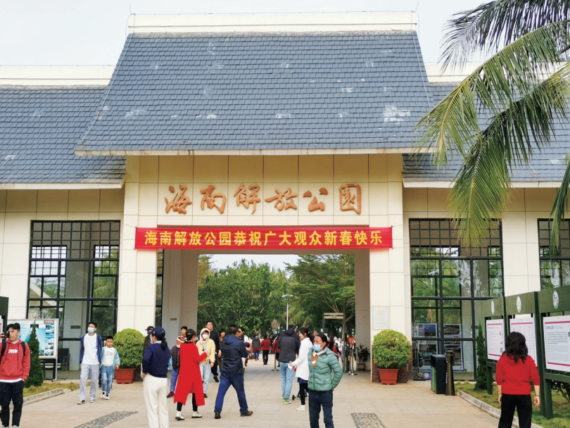
海南解放公园正门

新时代新征程，海南解放公园将继续砥砺前行、解放思想、敢闯敢试、大胆创新，努力把红色资源利用好、把红色传统发扬好、把红色基因传承好，讲好海南红色故事，让红色文化的魅力更强大、更深厚、更持久，为推动海南文化与旅游深度融合发展助力，为奋力谱写海南自由贸易港新篇章增添红色文化底色。