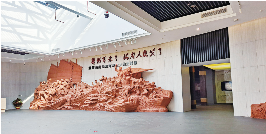
解放海南岛渡海战役纪念馆序厅

千帆竞渡破波浪，奇兵十万下海南。1950年5月1日，人民解放军成功解放海南岛，揭开了海南历史发展新纪元。解放海南岛战役是在我军没有制海权和制空权，没有制式军舰的情况下，仅凭2000多艘木帆船和100多艘机帆船，就横渡琼州海峡，一举突破国民党军在海南岛构筑的“伯陵防线”，将红旗插上了“天涯海角”，创造了木帆船打败铁甲舰的奇迹，开创了史无前例的陆军单兵种渡海作战的成功先例。