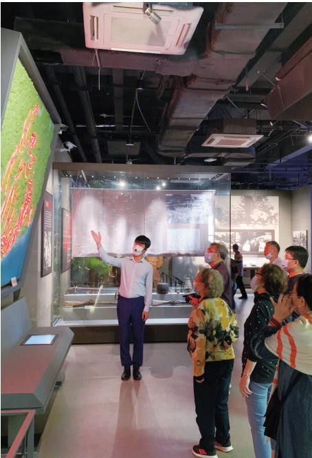
游客参观解放海南岛渡海战役纪念馆