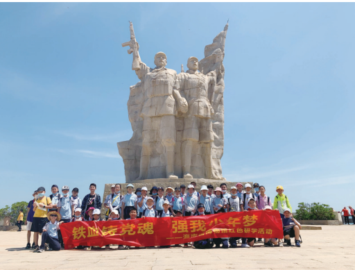
海南解放公园内开展研学活动