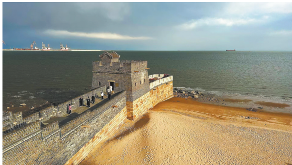
山海关龙头修复后