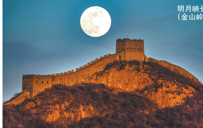
月明映长城（金山岭）