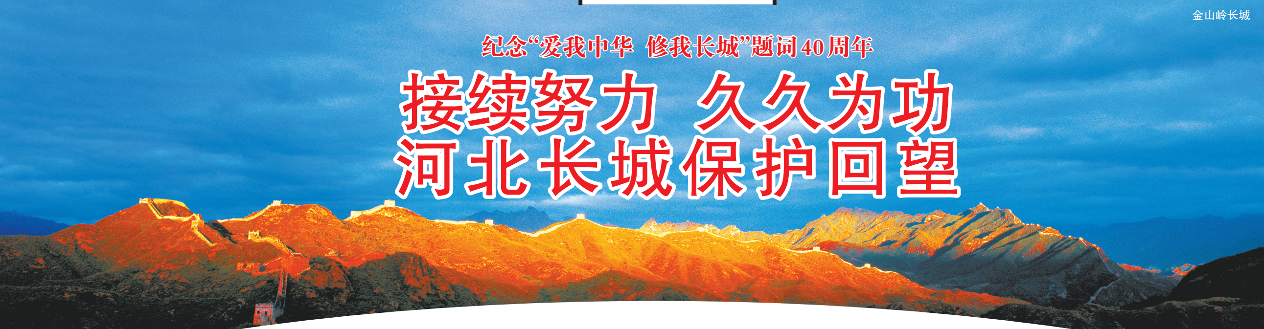
纪念“爱我中华 修我长城”题词 40周年