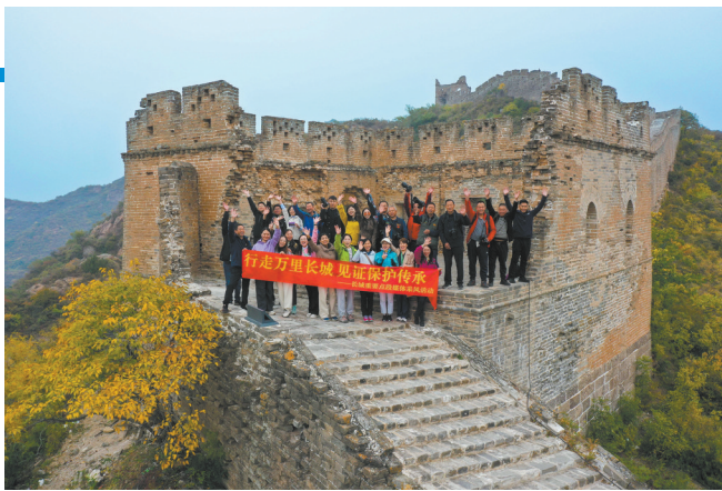
2023 年 10 月，河北省文物局组织媒体记者长城采风活动