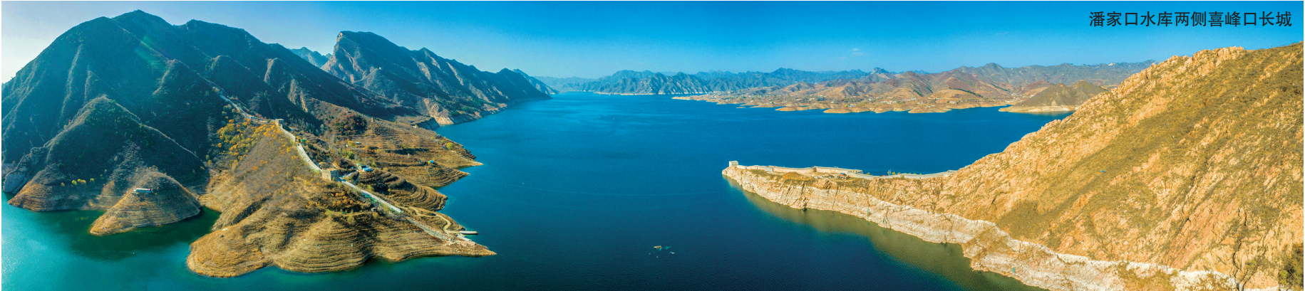
潘家口水库两侧喜峰口长城