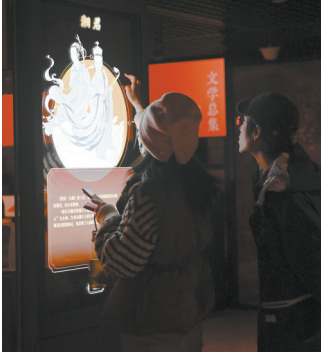
观众体验《楚辞》透明屏