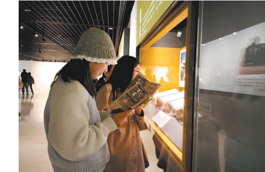
观众在展厅体验沉浸式互动解谜游戏

典籍长河生生不息,历久弥新。借助“亘古巨制 煌煌文脉——中华优秀传统文化典籍展”,让公众无论线下还是云端,皆可坐拥书城,一探华夏五千年文明,让活起来的典籍滋养中华儿女的文化自信,创造出属于我们这个时代的新文化,建设中华民族现代文明。