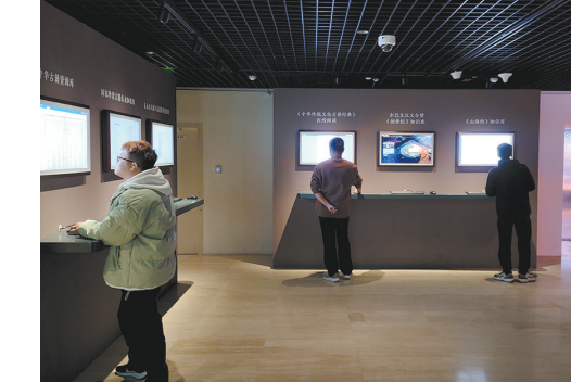
观众在数据库资源互动体验区中检索查看典籍

本展览为观众了解典籍类展品提供了更多的渠道和便利。观众在展厅欣赏珍贵古籍的同时,还可扫描展柜上的拓展阅读二维码,进入国家典籍博物馆网站里对应的典籍页面,该页面不仅有对这本典籍的基本介绍,还链接了古籍资源库、百部经典在线阅读、国图公开课等平台内与其相关的视频、出版物、详细解析等内容。