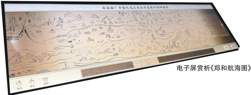
电子屏赏析《郑和航海图》