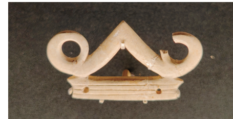
玉冠饰 安徽省文物考古研究所藏