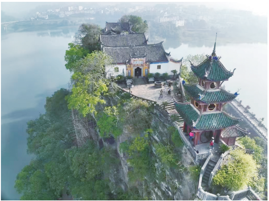
“四普”实地调查用无人机拍摄的重庆石宝寨

“四普”直播走进太原市尖草坪区赵家山村现场。网友在镜头的记录下，跟随普查队员的脚步，了解“四普”工作的细节，了解身边的文化遗产。 据介绍，在下一阶段工作中，各地正严把时间节点，创新工作机制，不断提升效率，确保外业调查与内业整理不脱节，加快推动普查数据录入，落实落细文物安全责任，确保实地调查高效高质量完成。 寒冬腊月，“四普人”依然奋战在乡间田野，穿梭于偏僻角落，把火热的激情播撒在实地调查一线，找寻每一处文物点，为高质量完成文物普查阶段性任务奉献力量。