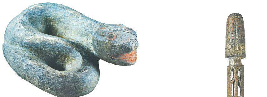
图3 四川金沙遗址出土的石蛇