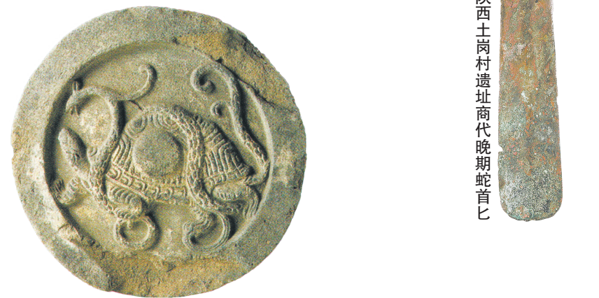
图6 陕西西安南郊汉代礼制建筑遗址上的玄武瓦当