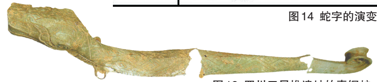
图12 四川三星堆遗址的青铜蛇