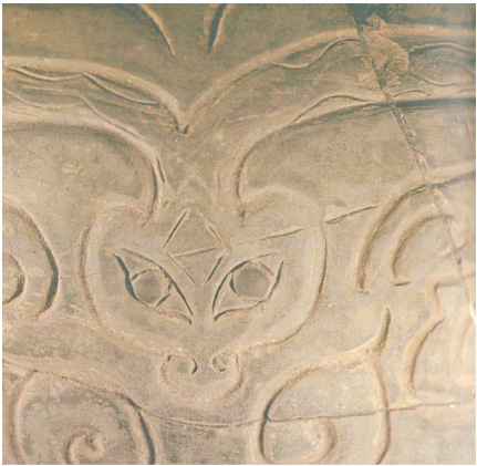
图2 河南二里头遗址陶片标本上的蛇形纹样