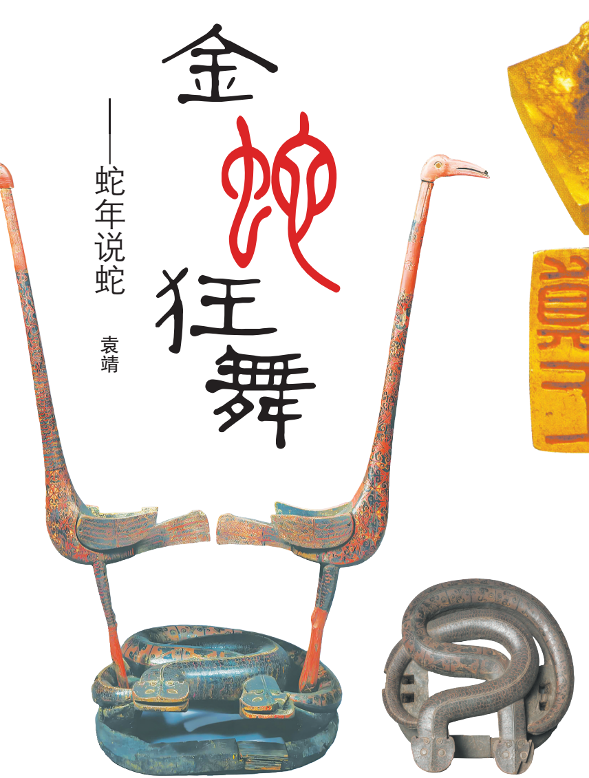
图5 湖南长沙发现的蛇座凤鸟鼓架及其蛇座