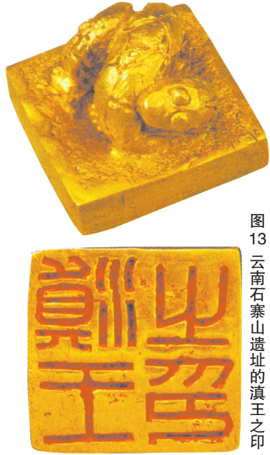
图13 云南石寨山遗址的滇王之印