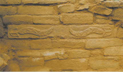
图1 陕西神木石峁遗址的背向双蛇