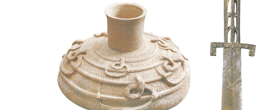
图4 江苏邳城墩墓的蛇纹原始青瓷鼓座