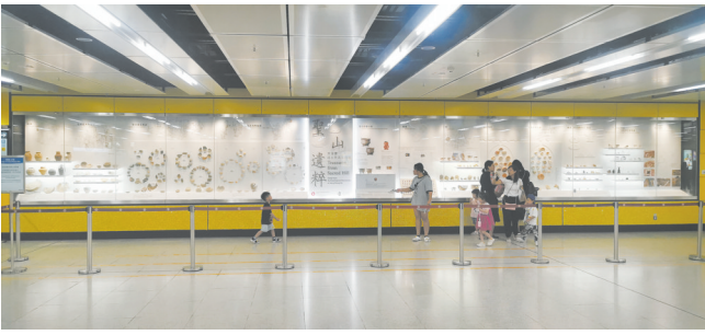
香港地铁宋皇台站“宋皇台出土宋元文物展”