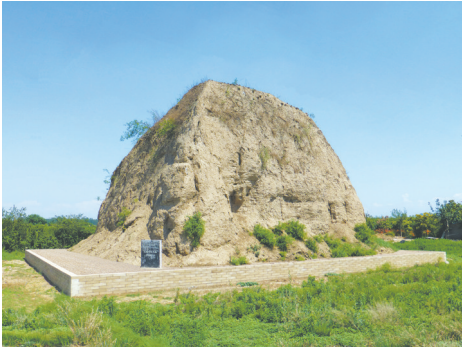
未央宫 J100 号夯台遗址保护后

如今，汉长安城未央宫国家考古遗址公园已经成为集文化展示、旅游休闲、农业观光、沉浸体验的多功能文化景区，仅 2024 年国庆假期就接待游客 14.07 万人次，使大遗址保护利用成果惠及更多民众，在文化建设中发挥着重要作用。（作者单位：西安市汉长安城遗址保管所）