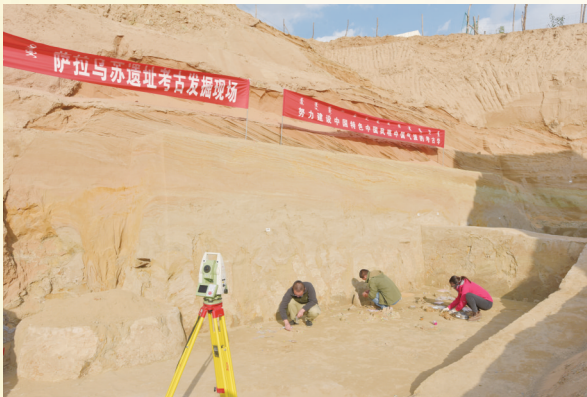
2021年萨拉乌苏遗址发掘现场