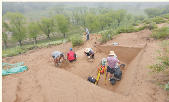
2022年范家沟湾发掘现场