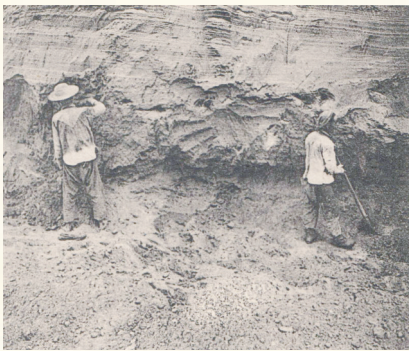
萨拉乌苏1923年的发掘地层