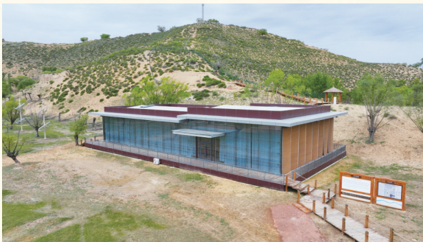
范家沟湾遗址点体验棚