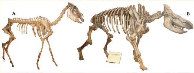
萨拉乌苏动物群化石标本