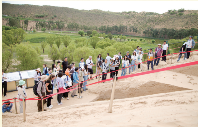
“河套人”发现100周年国际论坛实地考察