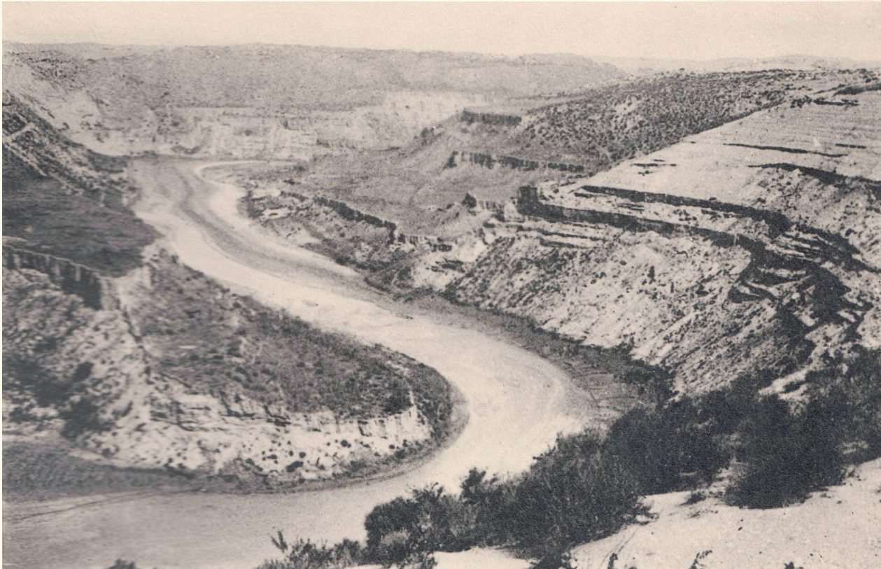
1923年的萨拉乌苏河谷

打造品牌活动。 以遗址的历史价值、科学价值及艺术价值为导向，融合独树一帜的自然景观价值，借助现有博物馆和遗址遗迹，立足乌审旗地域文化风情，塑造丰富多样的品牌主题活动。2023年成功举办“河套人”发现100周年国际论坛，借助国内外智库资源，达成一批新的研究