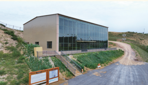
邵家沟湾遗址点、保护棚

共识，形成一批新的理论成果。2024年，央视科教频道《探索·发现》节目报道了《探秘萨拉乌苏》，为公众讲述了萨拉乌苏遗址的保护发掘现状以及这片土地蕴含的深厚底蕴，推动文化遗产保护、传承、传播。同年，来自全国各地的近千名徒步爱好者汇聚萨拉乌苏，在穿越峡谷的徒步竞赛中，感受“暖城之约·漫步山河·探索文明”活动的独特魅力。近两年，30余家媒体对各类活动进行宣传报道，新闻宣传共200余篇。