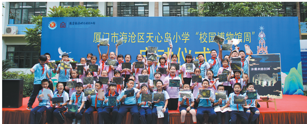
鼓浪屿外国文物馆走进校园