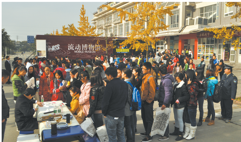
四川博物院流动博物馆走进成都中医药大学,同学们井井有条地排队参与自己感兴趣的活动