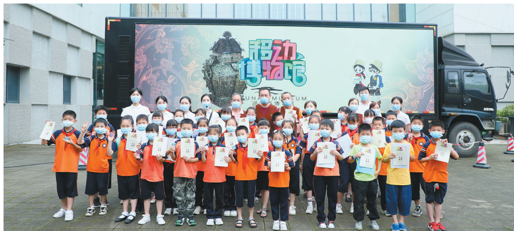
移动展览车前的合影(湖南博物院)