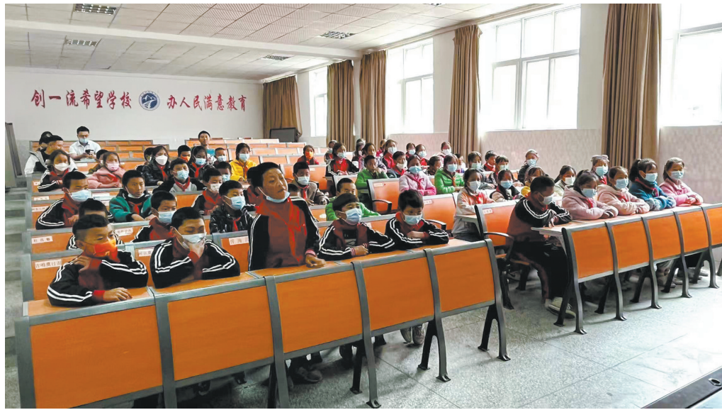
普格县铁道兵希望小学

在中国博物馆协会流动博物馆专业委员会的引领下,全国流动博物馆工作将积极承担博物馆优质文化资源直达基层的重任,进一步推动文化和旅游更广泛、更深层次、更高水平融合发展,促进博物馆与其他领域的融合互促,全面提升全国博物馆发展质量和社会效益。