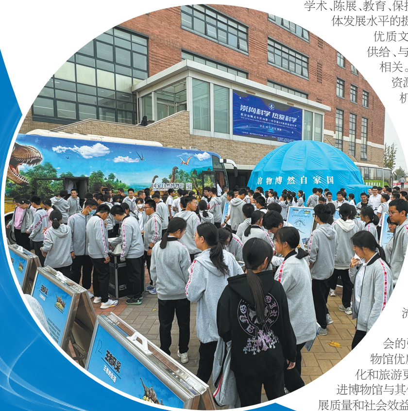
国家自然博物馆流动科普车项目