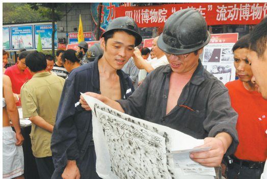
四川博物院流动博物馆走进企业——矿工们兴奋地欣赏自己亲手制作的拓片