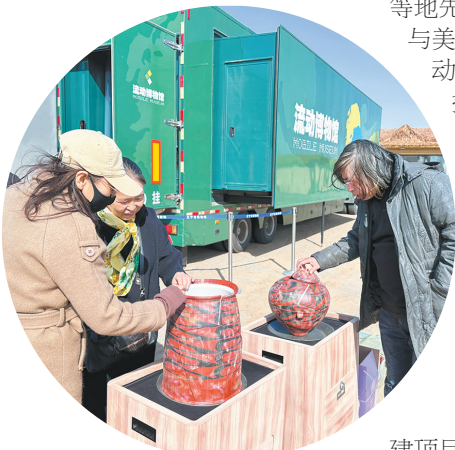
辽宁省博物馆流动博物馆