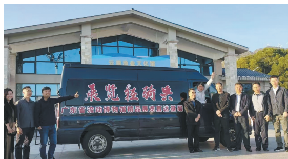
“展览轻骑兵——广东省流动博物馆精品展览直达基层”项目