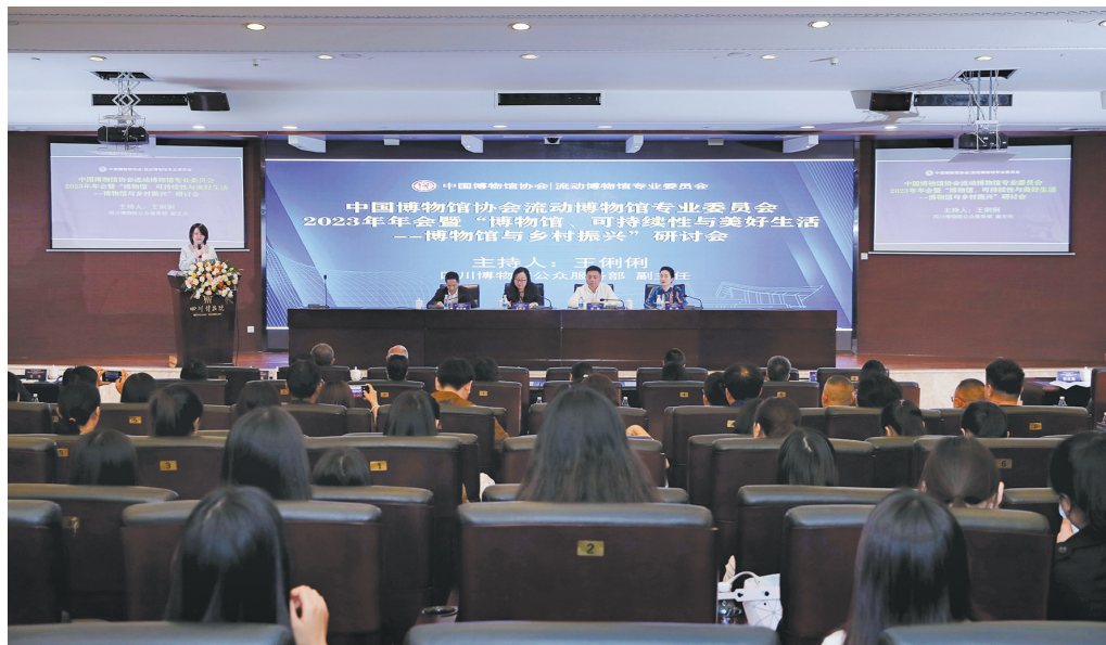
流动博物馆专业委员会“博物馆、可持续性与美好生活——博物馆与乡村振兴”研讨会