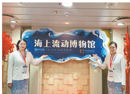
中国(海南)南海博物馆“海上流动博物馆”