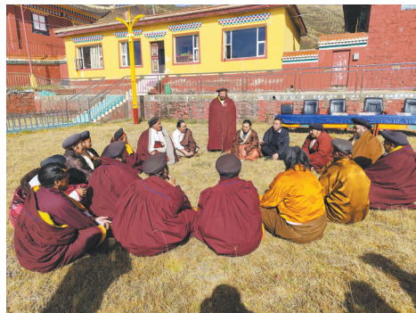
红原县玛萨寺的僧侣们讨论展览内容