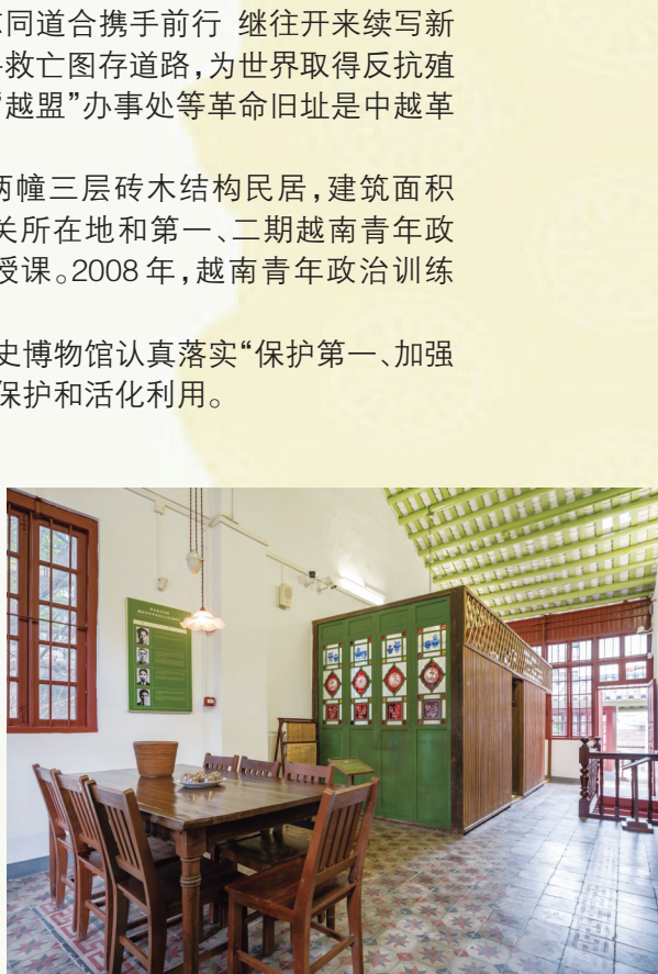
越南青年革命同志会总部会议室复原场景