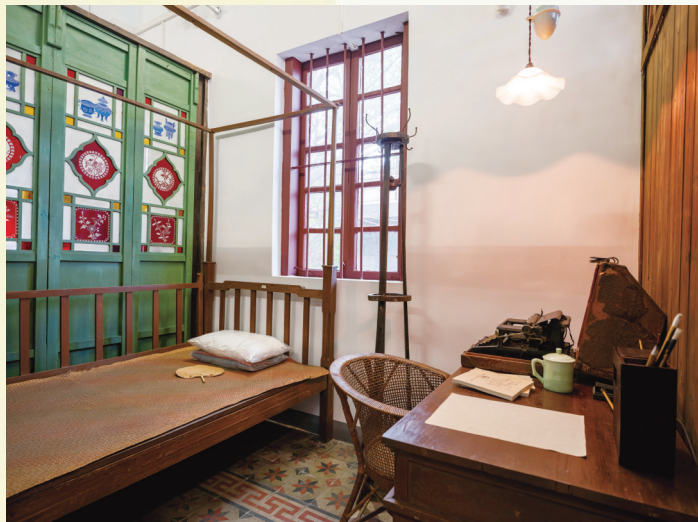
胡志明同志卧室复原场景