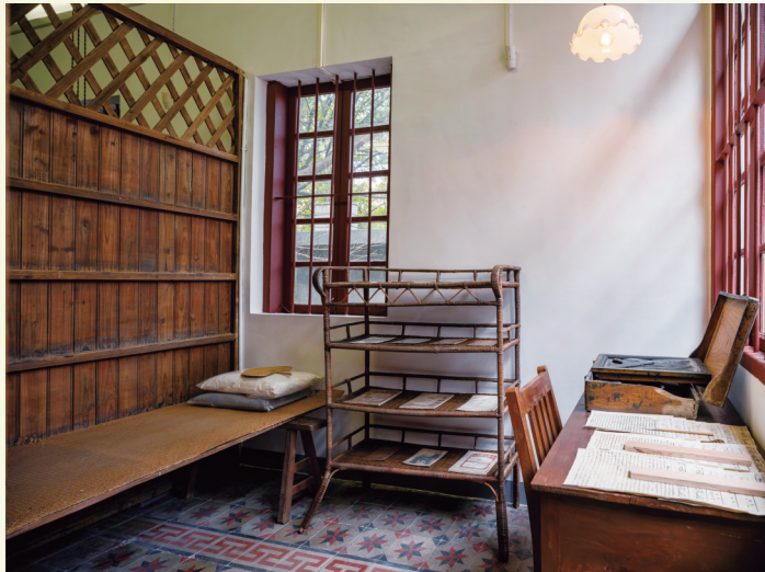
《青年》报印刷室复原场景