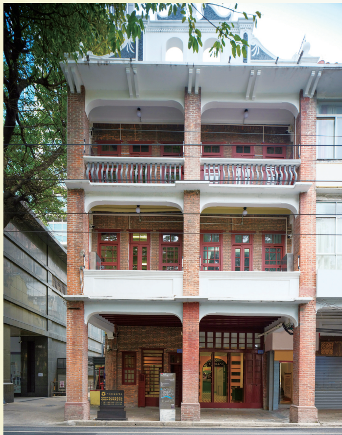
越南青年政治训练班(越南青年革命同志会)旧址