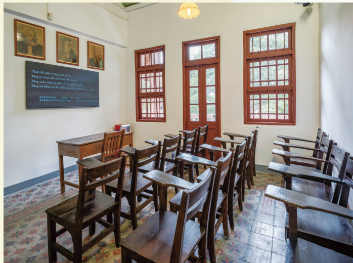
越南青年政治训练班教室复原场景