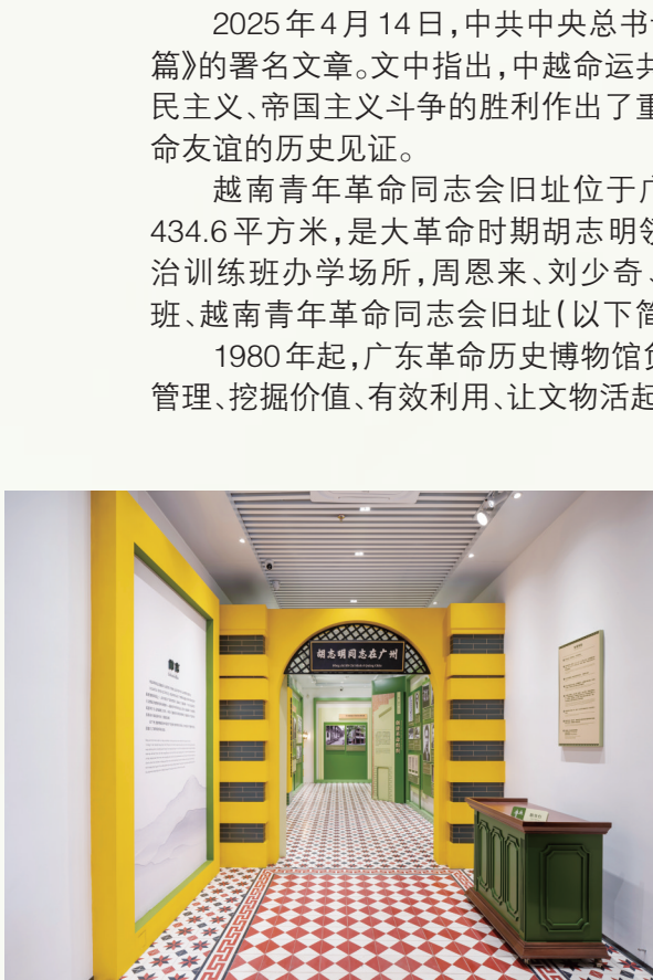
“胡志明同志在广州”展览