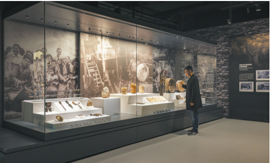
羌族释比文化展品组合