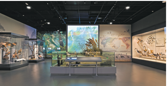
自然专题“生命之树”展厅

“天与工巧：古代工艺展”展出陶瓷器、鼻烟壶、铜镜、玉器、珐琅器、竹木牙角器等古代工艺品，展现中国古人纳天地于造物的卓越智慧和才能。“翰墨书香：书画艺术展”展出从元至清重要名家的书法与绘画作品，以及“竹庵藏纸”（杨啸谷先生旧藏）之珍贵古纸、古墨、砚等。多年来深藏博物馆库房的元代黄公望、王蒙合作山水图，近代张大千罕见巨幅《黄山松云图》，都因良好的展陈条件得以出现在展厅最醒目的位置。“尺幅寸心：织绣艺术展”展出清末民国服饰艺术珍品。织绣以蜀绣为主，兼含国内各大名绣。以类型多样的服装、琳琅满目的绣品、用途各异的装饰品，辅之罕见的近代坊间织绣样本，较为系统地呈现这一时期中国传统服饰文化的面貌。