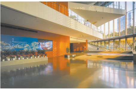
四川大学博物馆三层挑高的入口大厅

展览耗时三年，包括灯光、展柜、展具、展架、艺术品设计均精心打磨，精益求精。恒温恒湿设备为文物营造了优越的保存条件，大面积低反超白玻提供良好的观展体验。空间内采用散点化布局，复合式展示，灵活布置各种组合式展柜、通柜、地中柜、宽柜、特制展柜等。运用镂空支架、悬浮展陈、水晶亚克力展托等多种方式，弱化形式的视觉干扰。单元空间采用类舞台、场景化设计方式，文字表述简洁、准确，立面装饰追求清丽、脱俗。在整体均衡与典雅的空间环境里，帮助观众始终专注于内容本身。