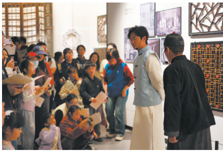
大学生自创《锦城旧事》演绎式导览

视、封面新闻等地方媒体的频繁报道。与央视《国宝·发现》、四川电视台等团队合作拍摄宣传片；与四川传媒集团联合开展“少年派科普”互动活动。利用网站、微信、微博、小红书等新媒体与主流媒体协同发力，有力推动博物馆文化传播与品牌建设。发挥大学博物馆平台和人才优势，组织举办了两届“创想博物馆”文创大赛，吸引国内外几十所高校和文化企业共1500多个团队参赛设计，打造学、研、产融合的博物馆文创产品开发新模式。