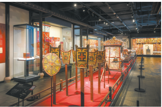
上草市街“鸿发号”轿行全套婚嫁用品

发，通过建立藏品之间、藏品与档案之间的系统关联来勾勒展览逻辑，形成最能代表川大博物馆自身特色的基本陈列——“西南天地 云汇大川”；“2”即两个专题陈列：充分发挥馆藏丰富的动植物标本收藏优势，借助生命科学学院的最新科研成果，以面向青少年和社会公众实施科普教育为目标，形成自然专题陈列：对人藏较为偶然、不具备鲜明的西南地域特色的人文类藏品，精选佳作，以类相从，形成艺术专题陈列，满足文博专业人才培养与公众审美意趣的需要。