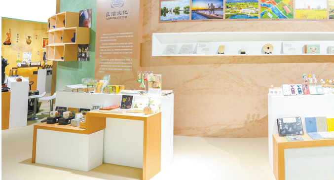
良渚文创产品参加第五届中国国际文化产业博览会

古合作新模式。同时，也将联合国外知名大学和研究机构建立东西方文明比较研究平台，建立起常态合作交流机制，以此为基础，进一步打造良渚文化学术高地，在国际遗址保护研究领域发出“良渚声音”，为文化遗产国际交流打造“良渚案例”。