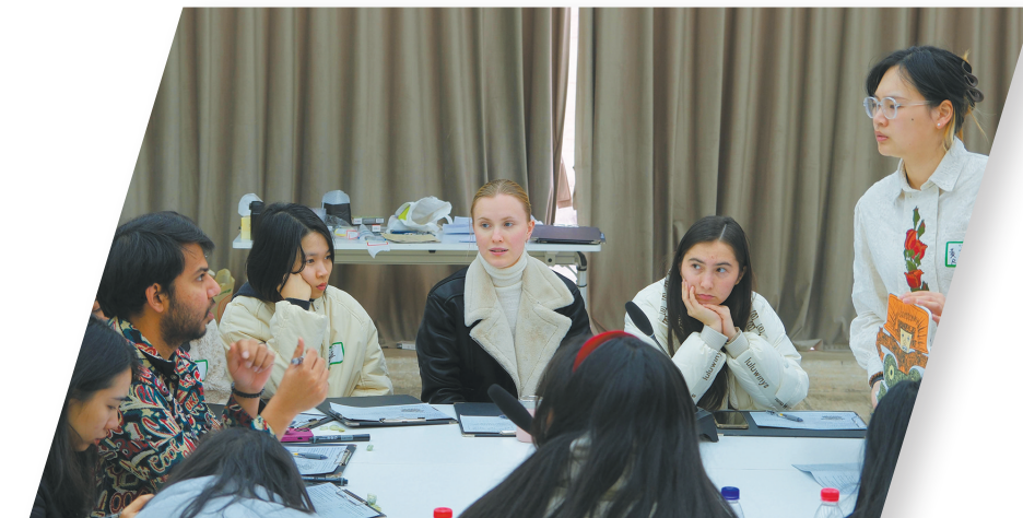
国际青年参加交流活动