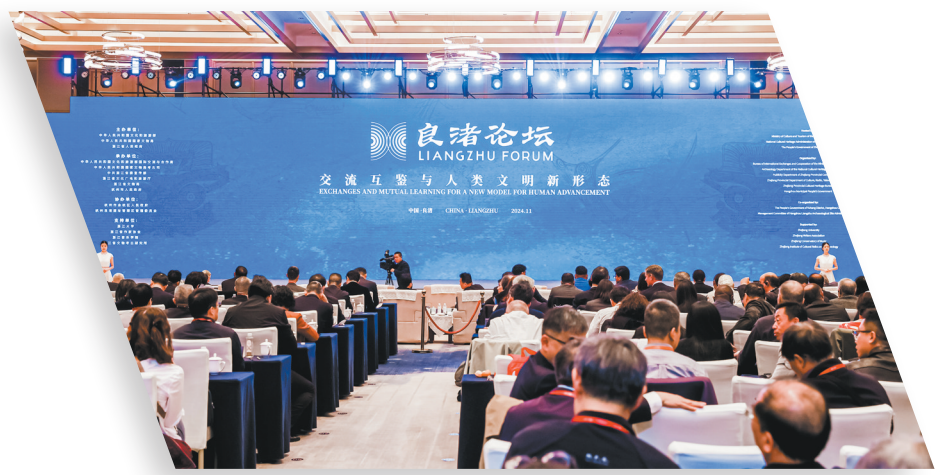
第二届良渚论坛主会场