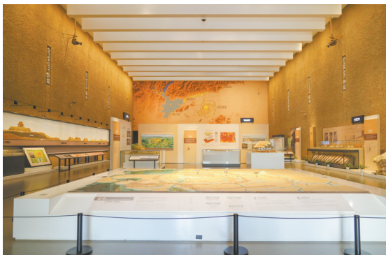
良渚博物院“文明圣地”展厅