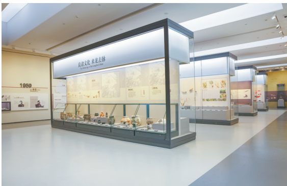
良渚博物院“水乡泽国”展厅