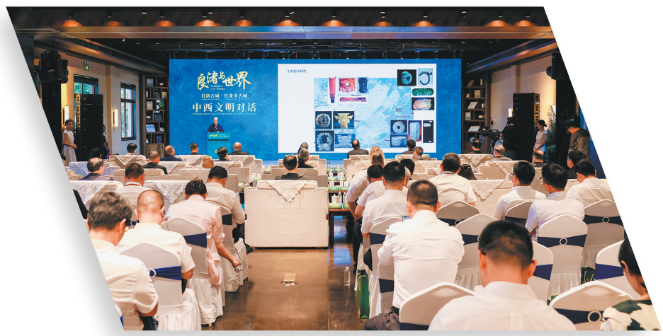
“良渚与世界”——中国西班牙文明对话活动