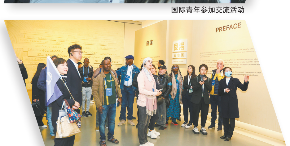
第一届良渚论坛参会嘉宾在良渚博物院参观