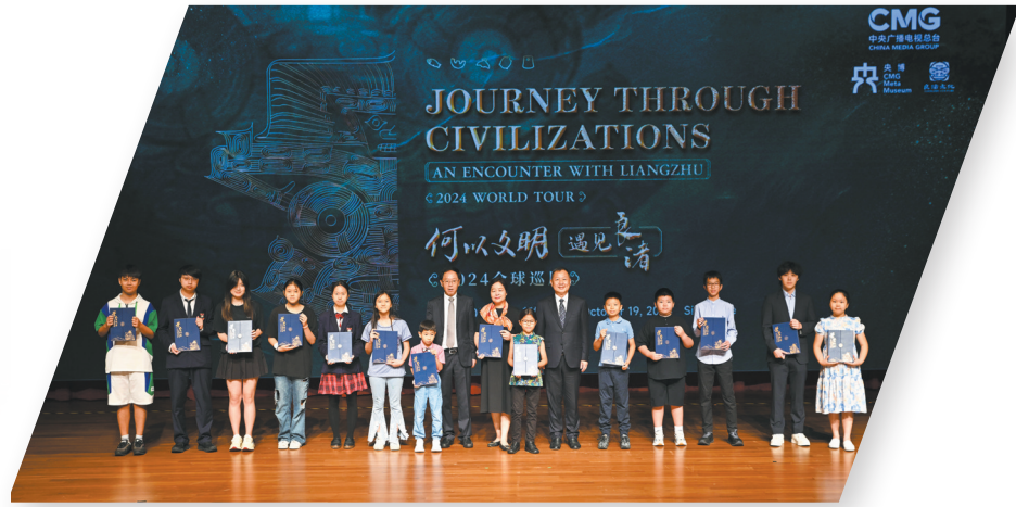
“何以文明·遇见良渚”全球巡展开幕式活动现场

站在新的历史节点，良渚的使命愈发清晰：它不仅是中华文明“多元一体”进程的实证地，更将成为人类类群可持续发展命题的灵感源。从史前稻作农业的生态智慧到当代数字守护的科技实践，从古城水利系统的精密设计到全球气候治理的文明启示，良渚正以跨越时空的对话，为构建人类命运共同体提供古老而鲜活的答案。未来，良渚人将继续以敬畏之心守护遗址，以创新之力激活价值，以开放之姿拥抱世界，让这座东方文明灯塔，永远闪耀在人类精神的星空。