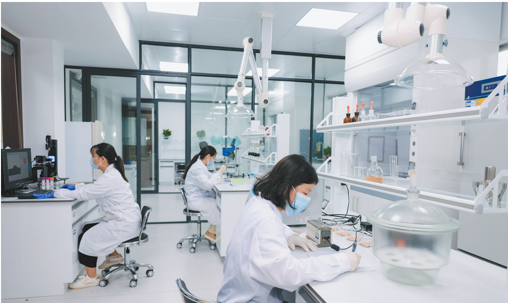
潮湿环境土遗址保护实验室

经过多年持续升级完善，该应用累计巡查量已超过38.7万人次，整合46万余条气象文化研究数据。更为难得的是，这一集考古、科研、保护、利用等功能于一体的大遗址文化应用系统，促进遗产公共文化服务标准化、均等化，为游客能在遗址前穿越古今提供可靠保障，在持续强化大遗址综合保护能级的同时，推动世界遗产资源有效转化为文化发展动能。