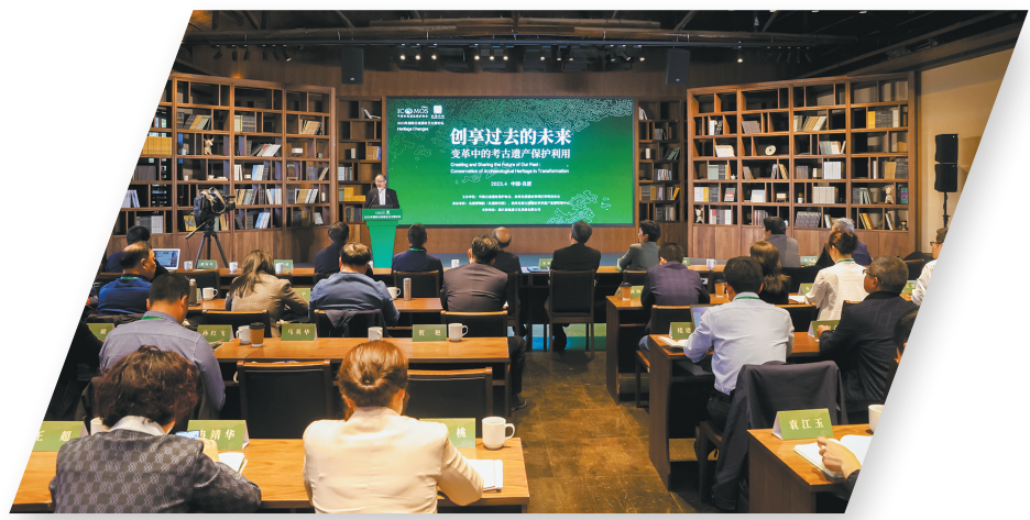
2024国际古迹遗址日世界文化遗产主场活动