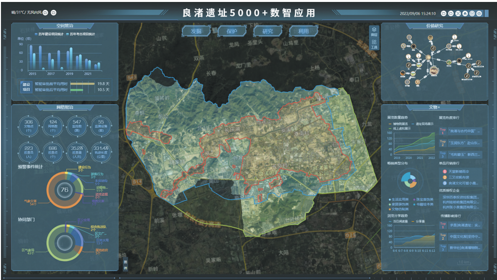
“良渚遗址5000+”数智应用大屏