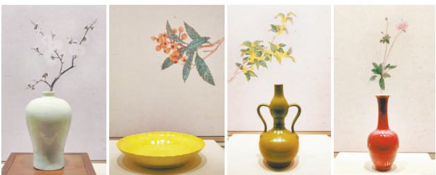
“云舒霞卷”单元展柜及“插花”效果

在内容展示上,力求精准、凝练,追求文辞优美、雅致,文字排版亦注重形式美学,以匾额、挂屏、窗框等建筑装饰元素设计呈现,选用仿手写的雅致字体,既完美融合,又古色古香,颇有趣味,或直接使用标注清晰的原始档案高清图版,形成统一规整、重点明确的展陈效果。展览为每件/组文物针对性设