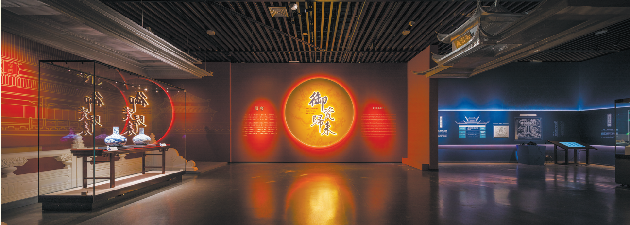
“御瓷归来”主题特展序厅

在时代上,展品覆盖从明洪武到清宣统的明清两代共 21 朝作品。序厅两件明永乐青花云龙纹天球瓶,是御窑“出道即巅峰”的代表作,龙纹气势雄浑,青花浓艳瑰丽,与“御瓷归来”主题相契合。第四部分结尾的宣统矾红彩龙纹西餐具,西式器形结合中式纹样,昭示着御窑与御瓷走进一个新的历史发