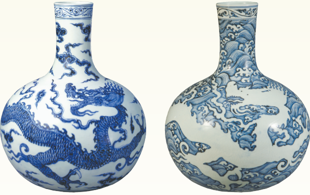
明永乐 青花云龙纹天球瓶

在内容展示上,力求精准、凝练,追求文辞优美、雅致,文字排版亦注重形式美学,以匾额、挂屏、窗框等建筑装饰元素设计呈现,选用仿手写的雅致字体,既完美融合,又古色古香,颇有趣味,或直接使用标注清晰的原始档案高清图版,形成统一规整、重点明确的展陈效果。展览为每件/组文物针对性设