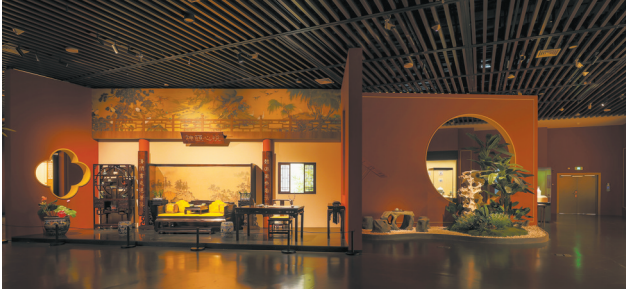
御瓷使用场景展示

情景营造不是单纯的置景,而是承担着资料补充、历史还原、辅助展线等重要功能。如宫廷日常用瓷场景考据大量明清宫廷绘画及故宫原装陈列照片,将御瓷作为陈设、文房、花器、家具、茶器等各种功能集于一体,直观展示宫廷日常生活中御瓷的不可或缺。