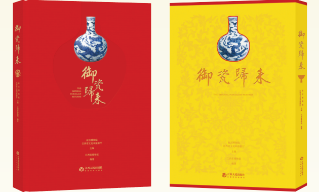
《御瓷归来》图录封面

今年 1 月,在“御瓷归来”展览开幕一周年之际,《御瓷归来》图录正式面向公众出版。图录依展览体例精心编排、制作精良,荟萃展览精华,图文并茂、阐述详备,集学术研究与艺术审美于一体,让展览的生命以书籍的形式记录和延伸,成为中华优秀传统文化展示的典藏之作。