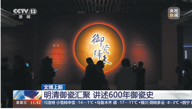
央视新闻报道“御瓷归来”主题特展

在微信、微博、小红书、抖音等社交平台成功“跨界破圈”,掀起打卡御瓷展的热潮,形成线上互动“种草”,线下参观反馈的良性正向循环。针对不同平台的受众群体,创设不同讨论话题,深度挖掘展览中的新颖内容,结合网络热点,展览宣传工作取得巨大成功,各平台累计浏览量超 8400 万,点赞量超百万,互动量、发帖量也是屡创新高。