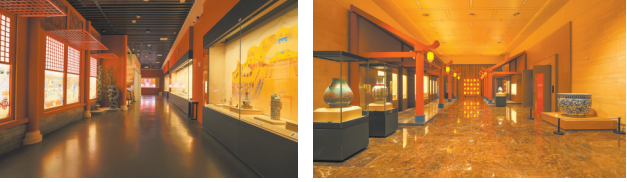
“御瓷归来”主题特展五大部分