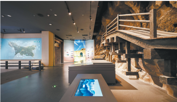
“纵横秦岭 道通古今”沉浸体验空间