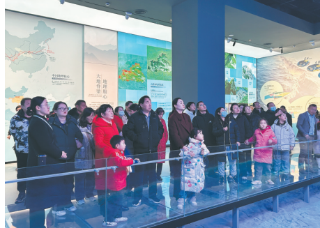
游客观看“大地脊梁”多媒体

在空间规划上,着力打造沉浸式展陈空间。借鉴央视春晚《富春山居图》等优秀节目案例,创新运用数字技术手段,实现文物展品的活化转化,精心设计可感知、可参与、可体验的展陈内容体系。特别注重面向青少年的“关键沟通”设计。为激发探索青少年的自然热情,展览设置“翻转版”“猜猜我是谁”“来看一看吧”“和恐龙比一比”等系列互动游戏项目,将秦岭特色生态与动物形象,以声光电多重感官互动进行呈现,让青少年在趣味体验中增进对秦岭动植物宝库的认知与热爱。多媒体技术运用坚持科学适度原则,采用高清投影、电视纪录片、三维动画三种形式,系统介绍历史背景、秦岭地质演变和相关文物知识。展厅引入移动滑屏、增强现实(AR)、MAPPING投影、虚拟漫游等前沿互动技术,实现虚拟信息与现实环境的完美融合,打造虚实相间的观展体验。