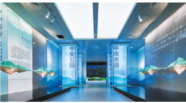
“守护秦岭 永续根脉”展厅