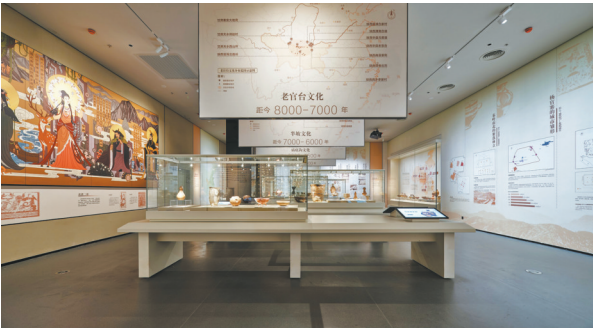
“文明肇启”新石器时代展区