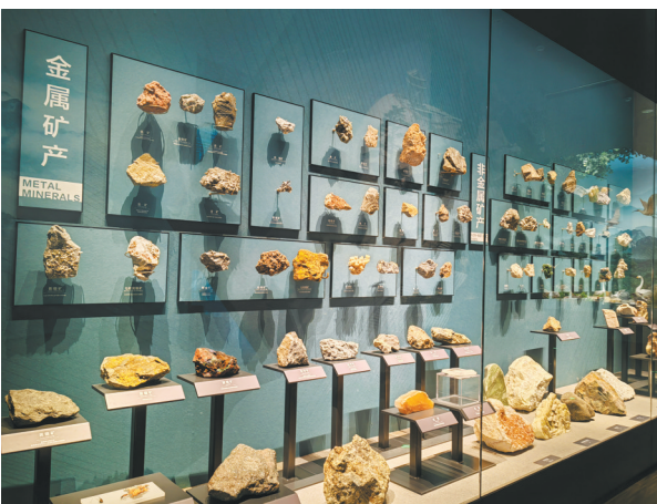
“自然馈赠 储矿藏珍”展区

第二单元“厚重秦岭 中华祖脉”,分五个小节,第一节“华夏先祖 文明曙光”主要讲述秦岭域内百万年人类史、一万年文化史;第二节“六合同风 华夏一统”聚焦五千年文明史,侧重展示秦岭域内周秦汉唐四大盛世,阐释秦岭在中华大一统格局中的标识作用;第三节“纵横秦岭 道通古今”涵盖秦岭古道文化、商贸文化,通过众多古道雄关遗址和古镇场景,再现南北文化经济交流盛况;第四节“多彩文化 同气连枝”提取大秦岭域内的六省一市代表性戏剧和文化遗存,呈现五大地域文化多元共生特征;第五节“文风礼义 精神家园”展示中华核心思想、宗教、技艺、艺术审美等内容,彰显中华文化精神内核。