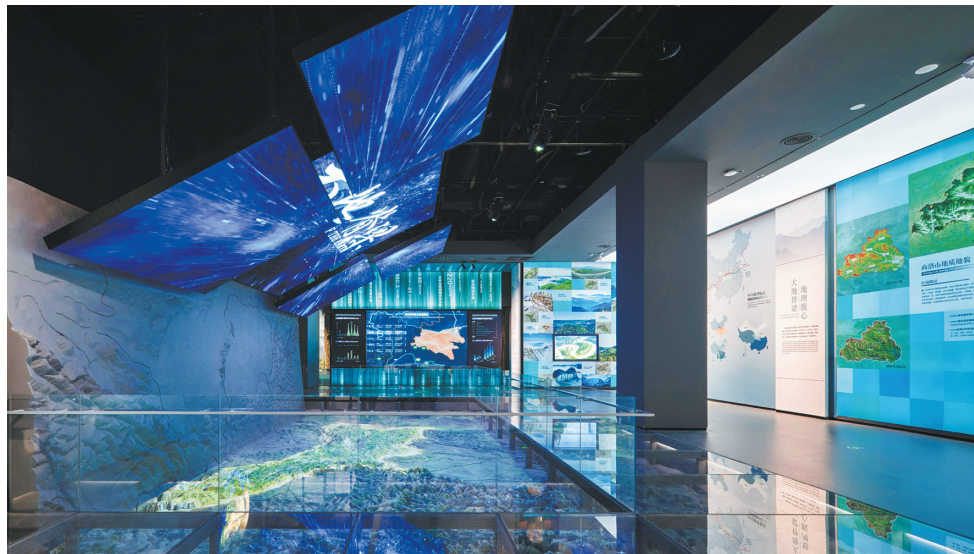
“大地脊梁”数字沙盘展区

“和合南北 泽被天下——中国秦岭文化展”自开幕以来,受到社会各界广泛关注,凭借独特的文化叙事与沉浸式展陈手段,通过宏大叙事、细节呈现与场景再现三者的紧密结合,收获了广泛的社会赞誉和积极评价。作为新时代秦岭山水文脉的重要传播平台,秦岭博物馆将持续深化文化内涵挖掘,拓展公众参与路径,使展览真正成为连接历史与当下、传统与现代的文化纽带,让每一位观众都能在这里感悟秦岭的精神,传承弘扬中华文化并努力推动秦岭文化走出去,向全国乃至世界讲好中国生态文明的秦岭故事,让世界在秦岭看到更真切的美丽中国。