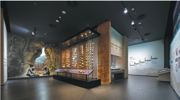
“华夏先祖 文明曙光”展区