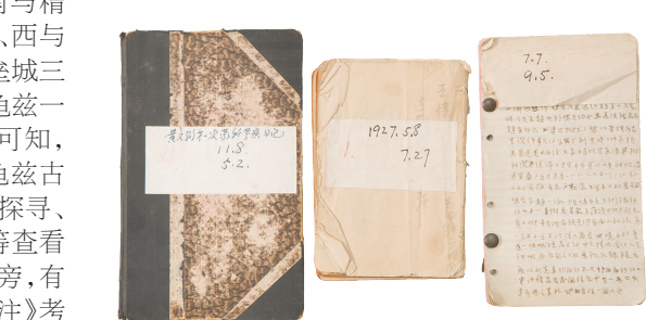
黄文弼第一次蒙新考查日记手稿图

【本文系中国国家博物馆馆级一般项目《中国国家博物馆馆藏西北科学考查团采集文物文献整理与研究》(项目编号:GBKX2024Y26)阶段性成果]