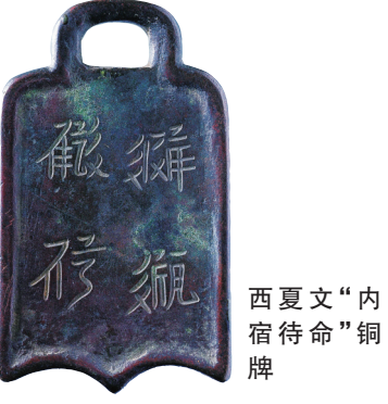
西夏文“内宿待命”铜牌

山西阳泉,是太行山中西部西麓一座迷人的小城,山河壮丽、历史悠久,几千年的历史沉淀留下了大量的历史文化瑰宝,拥有各级文物保护单位176处,其中全国重点文物保护单位11处。恰逢“五一”,走进山城阳泉,感受这片土地上文明的繁盛和文化的厚重。