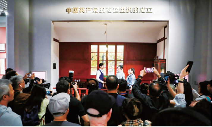
观众观看情景党课《破晓》

情景党课《破晓》叩响觉醒之门，限定纪念章镌刻岁月印记，“新青年读书荟”碰撞思想星火，红色音乐下午茶流淌激昂旋律，小小讲解员童声诉说百年风华……数十项匠心活动串联起精彩纷呈的“一大时辰”主题活动。5·18国际博物馆日，中共一大纪念馆紧扣“快速变化社会中的博物馆未来”主题，以别开生面的文化盛宴，奏响红色传承的时代新章，深度探索新时代博物馆社会教育功能与未来发展路径，彰显中国共产党诞生地深厚历史底蕴。