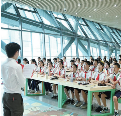
“走近文物、对话文明”系列主题活动现场