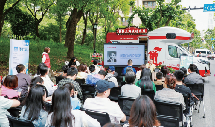
“新青年读书荟”讲座现场