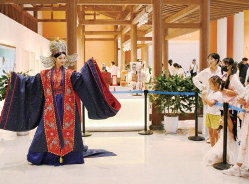
成都博物馆×蜀宴赋国风走秀活动现场