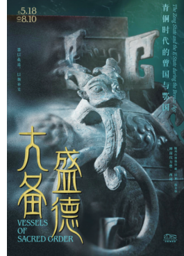
“大备盛德——青铜时代的曾国与鄂国”展览