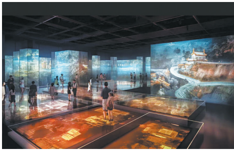
舍利塔地宫沉浸式展出体验效果图

未来,舍利塔地下整体建筑将作为史实再现的信息载体,成为人们体验多元文化的专业展陈空间。