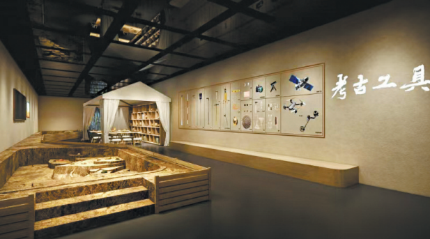
考古现场复原展示