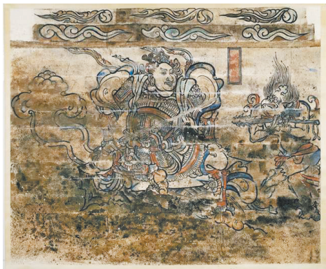
舍利塔地宫南面壁画(增长天王)