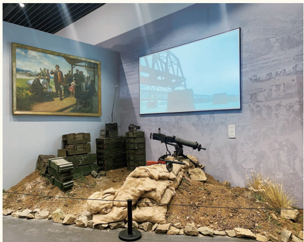
复原场景“寸土必争”