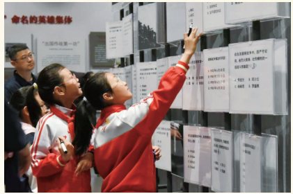
青少年在互动区答题

该展览的策划与推出强化了抗美援朝纪念馆的策展人机制，锻炼了年轻队伍。在时间紧、任务重的情况下，展览顺利于2025年5月8日进行首展。开展当天，“一部英雄史 赓续中华魂——纪念中国人民志愿军抗美援朝出国作战75周年专题展”全国巡展启动仪式在抗美援朝纪念馆举办。接下来，该展览将在全国范围内进行巡展，并配合研学活动、主题讲座、情景互动式党课等项目开展延伸教育活动，拓宽展览体系，扩大展览影响力，为红色资源的传播积蓄力量。