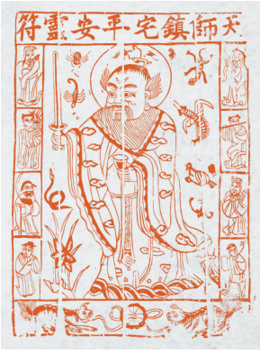
图6 木版年画《张天师像》（旧版新印）