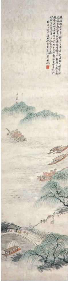
图2 汪鋆《龙舟竞渡图》清代