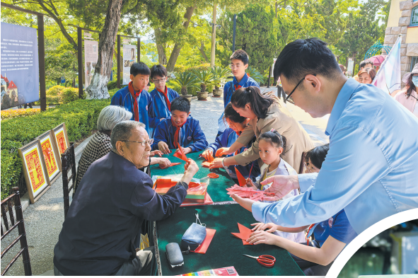
▲ 总督楼建筑艺术剪纸活动

青岛市城市文化遗产保护中心联动7家人故居场馆共同打造“青岛名人故居漫游”护照打卡活动，掀起城市“名人故居热”，参与者手持漫游护照，穿梭于青岛历史城区大街小巷，寻找藏在城市中的名人故居场馆，完成活动盖章任务，兑换专属礼品。活动整合了青岛名人故居资源，展示了名人故居