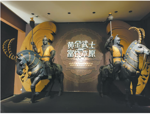
图4 哈萨克斯带来华展

以上六件文物均为扬州博物馆藏品，虽然材质不一、造型各异，却共同展现了端午时节的丰富习俗和深刻内涵，让我们感受到了传统文化的无穷魅力和持久活力。千年来，尽管时光更迭、岁月变迁，端午节依然像一阵浪漫而奋进的风，劈开竞渡的浪花，穿过时空的帷幕，带着菖蒲的清芬，让中华民族的文化基因在粽叶翻飞与龙舟鼓点中永续流传。