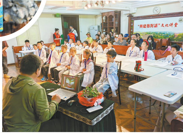
▲ “萌芽实验室”古堡植物养成记活动

场馆的活化利用成果，一经推出广受好评，系列限定款光影明信片、金属书签作为文化创意衍生品深受市民及游客朋友们的喜爱，引发了收集热潮，有效拉动青岛历史城区范围内名人故居客流数据，在提升场馆影响力的同时，增强了公众的参与度和体验感，带动青岛历史城区文博场馆联动发展；青岛康有为故居纪念馆打造“有为空间站”，将传统文化与时代融合，打造互动主题打卡空间，开展系列主题快闪活动，邀请游客朋友们穿越古今，开启名人故居探索之旅，参与者纷纷表示，通过新颖的活动形式感受到了城市新的文化魅力。