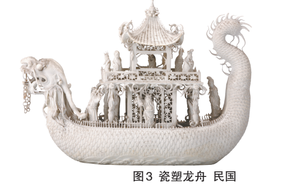
图3 瓷塑龙舟 民国