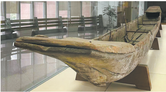
图1 独木舟 唐代