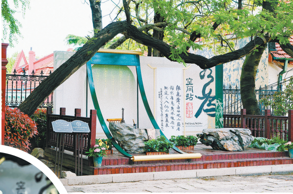
▲ 名人故居漫游护照打卡