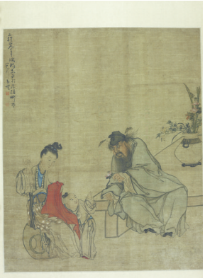
图5 黄慎《端午钟馗图》清代