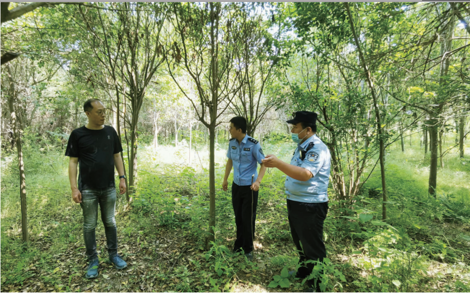
与辖区民警联合巡查

一是壮大文物考古队伍建设。根据山东省枣庄市关于加强文物保护和考古工作机构编制保障有关文件精神，滕州优化文物保护单位布局，整合市文旅产业促进中心、市非物质文化遗产保护传承中心等2个事业单位，新组建滕州市文化和旅游事业发展中心，加挂滕州市文物保护考古研究中心牌子，专项用于文物保护传承事务性工作和文物考古研究工作。新设立滕州市岗上遗址管理服务中心，专门负责岗上遗址管理服务和保护等工作。联合山东省文物考古研究院共同建设鲁中南文物保护与考古研究中心。该中心集国家重点地区考古标本库房、考古发掘与研究、文物保护与修复、出土文物及标本存放与展示和实验室考古、学术交流、业务培训等多重功能于一体。组织选派文物系统业务骨干参加全省考古勘探项目负责人岗前培训班和田野考古技术培训班，持续抓好考古人才培养，强化考古人才建设。