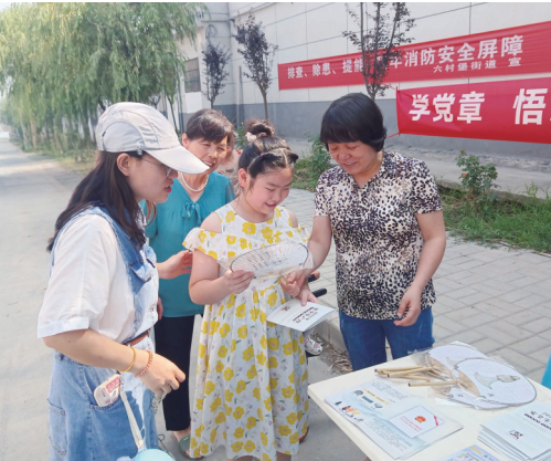
文物安全进农村活动

保管所积极开展安全教育宣传活动，创新形式，广泛宣传。在遗址公园、博物馆、办公区等场所的重点部位和明显位置设立安全宣传提示牌、宣传展板、消防安全宣传栏、LED显示屏等营造良好的安全教育宣传氛围。利用保管所微信公众号、微信粉丝群推送安全科普文章，不定期发送安全警示提醒，宣传安全相关知识，做到人人学安全、人人懂安全、人人会安全。通过博物馆“进社区”“进农村”“进学校”等专项活动，扩大宣传覆盖面，广泛宣传文物保护知识、相关法律法规，发放文物保护宣传册、汉长安城遗址调查问卷等，增强民众的文物保护意识和法治观念，让“保护文物 人人有责”的安全理念深入人心。