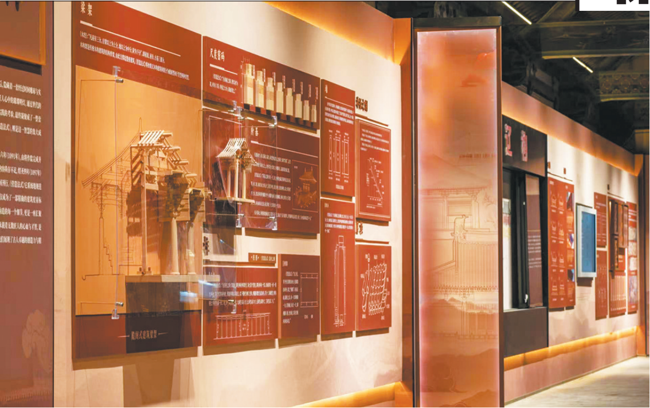
匠心营造——辽代木构技艺展