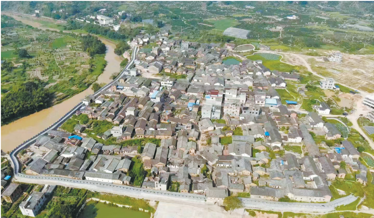
羊角水堡航拍全景图

第二期维修项目(6处古建筑):周九妹祠、烈振祠、彝公祠、周环江祠、凤吉祠、康吉祠,修缮类型主要为古祠堂。2019年6月启动工程,于2020年12月完成修缮工程,2022年6月,江西省文物保护中心组织专家到现场验收,2023年验收合格。