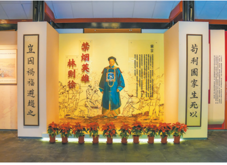
“禁烟英雄林则徐”展览