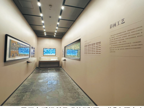
展厅东暖阁所呈现的“彩画工艺”主题内容