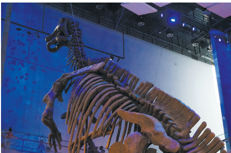
广东省博物馆“粤山秀水 丰物岭南——广东省自然资源展览”

近十多年,我国博物馆行业发展迅速,截至2024年底,备案博物馆达7046家。我国的综合类博物馆多以当地历史文物为主要展品,对于自然环境的研究展示较少。当下公众对环境议题的关注日益提升,博物馆作为重要的文化机构,承担着社会教育的重要使命,需加强对自然环境及气候变化问题的阐释。展示当地自然环境并不仅是自然科学博物馆的使命,历史类博物馆作为博物馆总量的多数,同样有责任向观众展示本区域的历史气候环境如何;有哪些生物曾在这片土地上生活与人类共存;气候环境的变化是如何影响人类迁徙、生活方式的改变,甚至是王朝更迭,等等。自然环境就是历史的重要组成部分,物种的生存、灭绝,人类生产生活方式的改变,社会文明发展轨迹的改变都与环境息息相关。本文聚焦于非自然类博物馆,尤其是历史类综合博物馆在基本历史陈列中展示自然环境的现状与路径探索,旨在将自然环境内容有机地融入历史叙事,推动博物馆更全面地呈现“人地关系”,提升展览的深度与科学性。