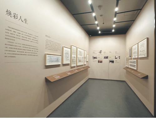
展厅西暖阁所呈现的“焕彩人生”主题内容