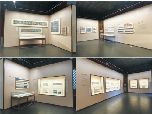
展厅主要展示空间中“彩画简史”的五大内容板块:敦煌彩画(左上)、唐宋彩画(右上)、元代彩画与明代彩画(左下)、清代彩画(右下)