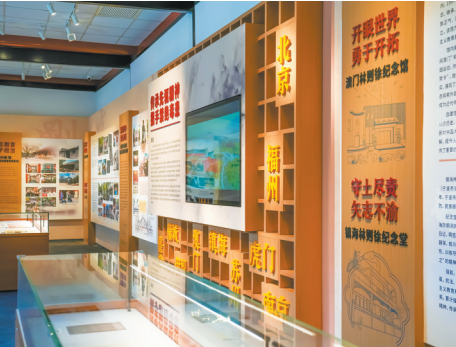
“传承先驱精神 携手禁绝毒患”展览

空间到微观细节都渗透着浓郁的历史文化气息。空间主色调选用具有历史沉淀感的暖黄色系,以象征文明之光和精神传承。为增强观众的参观印象,展区区域特借鉴老北京四合院建筑中常用的立体浮雕工艺,展示全国十处林则徐纪念馆所在城市名称。观众近距离参观时,不仅视觉上能感受到浓厚的历史韵味,还能通过触觉体验传统建筑的肌理质感。灯光设计方面,考虑展厅的建筑属性,采用暖色温照明设备,还原四合院室内自然光线的温暖质感。这种对传统建筑元素的现代化诠