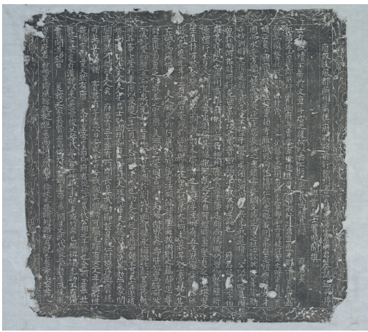
唐窦伯雄墓志拓片