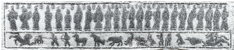
孔子弟子画像石拓片