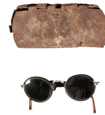
1927年陈潭秋革命工作时化妆用的眼镜