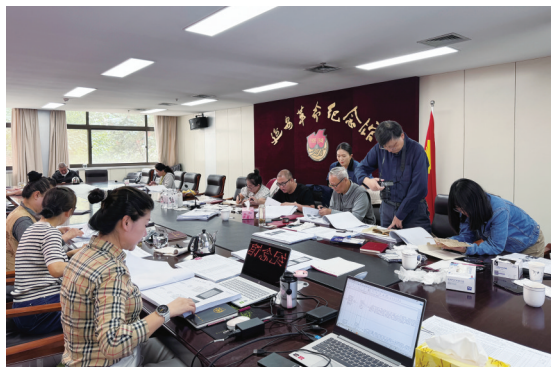
延安革命纪念馆开展革命文物鉴定工作

“保护好、管理好、运用好”革命文物，是发挥其在党史学习教育、革命传统教育、爱国主义教育等方面重要作用的前提。在高质量发展语境下，革命文物定级工作十分重要。定级属于文物工作链条的前端位置，在很大程度上框定了革命文物工作的水准上限。只有准确判定文物价值，后续的分级保护、库房管理、研究阐释、展陈科学利用才有可靠依据。然而，从一线馆藏的实际工作来看，当前革命文物定级工作存在诸多需要解决的现实问题，与高质量发展目标仍有差距。本文从一线工作实践出发，梳理文物定级过程中存在的共性与个性问题并提出相应建议，以期为行业规范化工作提供参考。