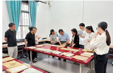
武汉革命博物馆组织召开馆藏文物定级专家会

他博物馆的检测资源进行探索,深切感受到基层博物馆科技检测能力的不足对定级工作的制约。