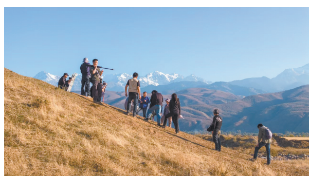
2024年10月《中国·考古》纪录片团队在哈萨克斯坦伊塞克大墓拍摄现场