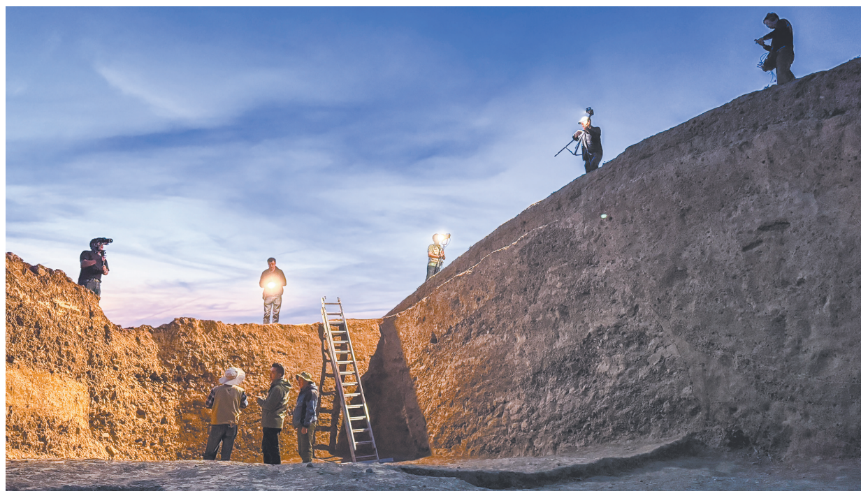
2024年10月《中国·考古》纪录片团队在哈萨克斯坦伊塞克大墓拍摄现场

近年来，一批制作精良、内容翔实、以文化遗产为主要传播内容的视频节目应运而生，成为优秀的国际传播作品。如何通过专业翻译、中外联合创作等方法，进一步推动中华优秀传统文化的海外传播，笔者认为关键是要解决好解读难、翻译难、共情难、理解难等瓶颈问题，实现让文化遗产类视频节目在海外的“破圈”传播。