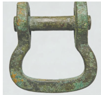
鄂尔多斯青铜器车马器（内蒙古博物院藏）