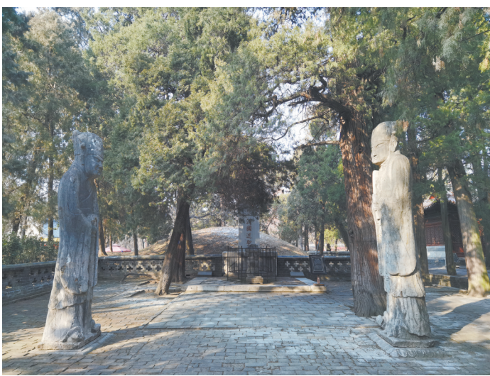
孔林宋代石人翁仲像

文化传承价值。古树名木是儒家文化传承的见证者，儒家文明的活态记忆库，其生长历程与历代文化活动相互交织，形成了丰富的