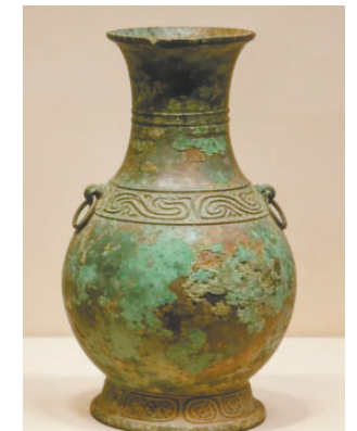
鄂尔多斯青铜器容器（鄂尔多斯市博物院藏）

质深深嵌入鄂尔多斯青铜器的发展历程，使其成为文化交融的直接见证。在形制设计上，借鉴中原鼎、壶等经典容器造型，结合游牧需求进行缩小尺寸、简化结构等适应性改造；在纹饰创作上，中原青铜纹饰云雷纹、几何纹与北方青铜器动物纹相互融合，庄重的中原审美与鲜活的草原特色相得益彰；在铸造工艺上同样使用了中原青铜器的范铸法、镂空、浮雕工艺技术，而动物纹等元素也传入中原，实现了草原文化对中原文化的反向滋养，形成双向交流、互补共生的文化格局。