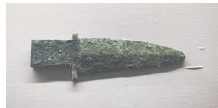
桃红巴拉遗址出土青铜短剑（内蒙古博物院、鄂尔多斯市博物院藏）