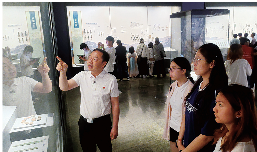
学院教师现场教学

在战国“双铍形铜戈”、西汉“执伞铜跪俑”等文物前，学生们凝神细观。讲解员提示，这些青铜器的造型与纹饰是文化深度交融产生的“化学反应”，而非简单的“符号拼盘”。这些兵器既延续中原青铜戈形制，又融入本地独特的礼器功能与独特的太阳纹、涡纹；“执伞铜跪俑”的仪仗制度仿自