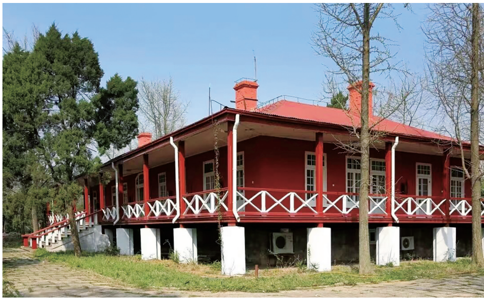
浦镇车辆厂内英式建筑修缮后