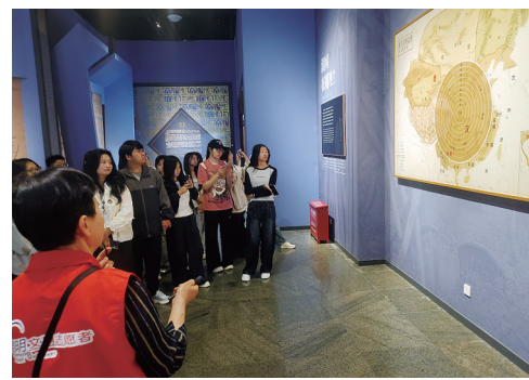
讲解员为大学生导览

西南林业大学马克思主义学院教师认为，将思政课堂移至博物馆，让文物说话、让历史育人，是“大思政课”守正创新的有效路径。本次实践教学