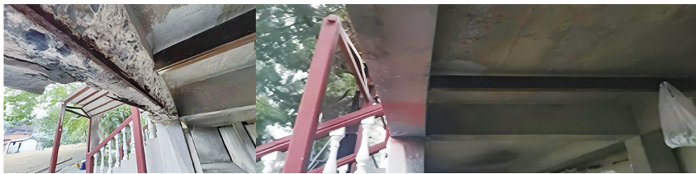
北侧梁体修复前(左)后(右)对比