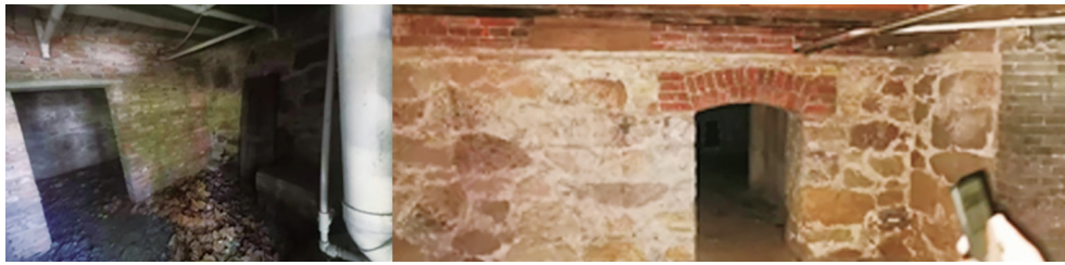
下部通风层挡水台修复前(左)后(右)对比