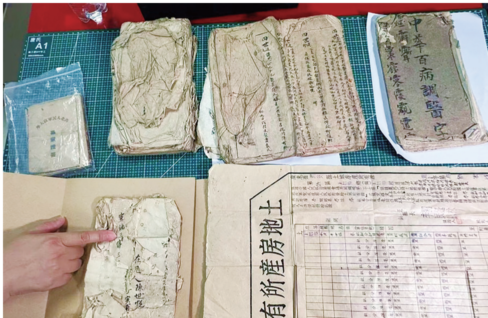
海南省博物馆面向全社会公开征集的纸质藏品