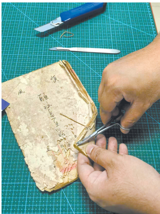
修复人员对纸质藏品进行修复工作

文物保护修复：从“馆藏优先”到“民间纳入”。 传统修复资源主要服务于馆藏文物，民间藏品长期处于保护真空。“传家宝”活动首次将专业修复服务延伸至普通市民，使保护对象从“珍贵文物”拓展到“有历史价值的民间文献”。更路簿记录南海航行经验，侨批承载华侨家族往事，族谱保存地方迁徙脉络——这些纸质资料未必达到等级文物标准，却承载着不可替代的海洋文化、华侨史与家族史信息，其保护本身就是文化遗产多样性的维护。