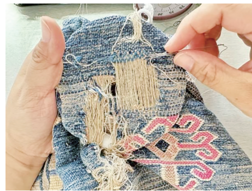
用织补针排出平行的经线