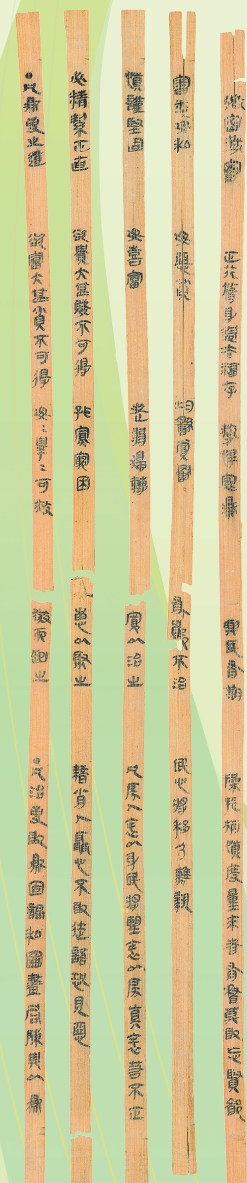
睡虎地秦简《为吏之道》