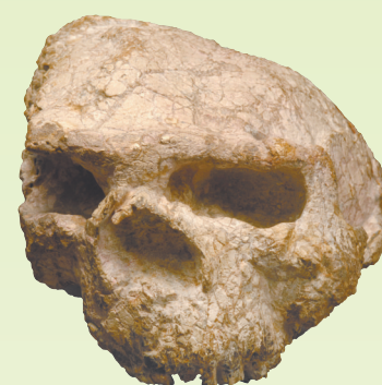
郧县人 | 号头骨化石