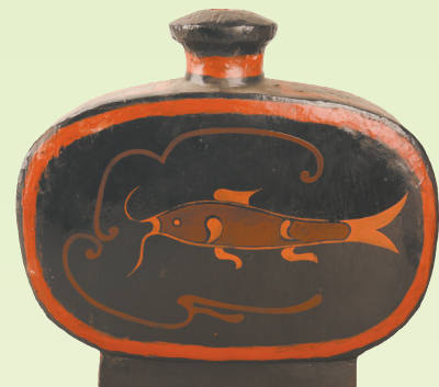
彩绘猪鸟鱼纹漆扁壶