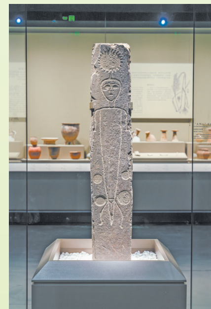
“极目楚天——湖北古代文明”展览展厅