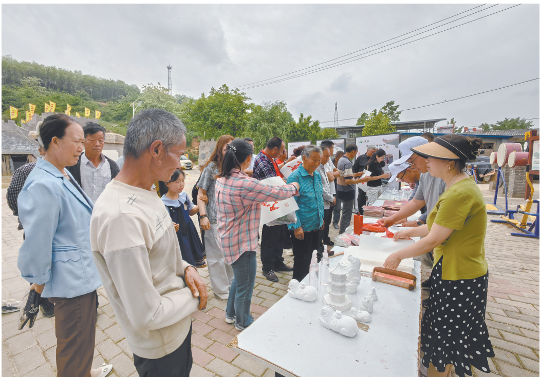
宜君县博物馆文博主题宣教活动走进黄埔寨村

今年国际博物馆日恰逢周一，北京、内蒙古、贵州等多地博物馆打破“周一闭馆”的惯例，临时