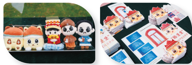
一城三馆IP形象发布