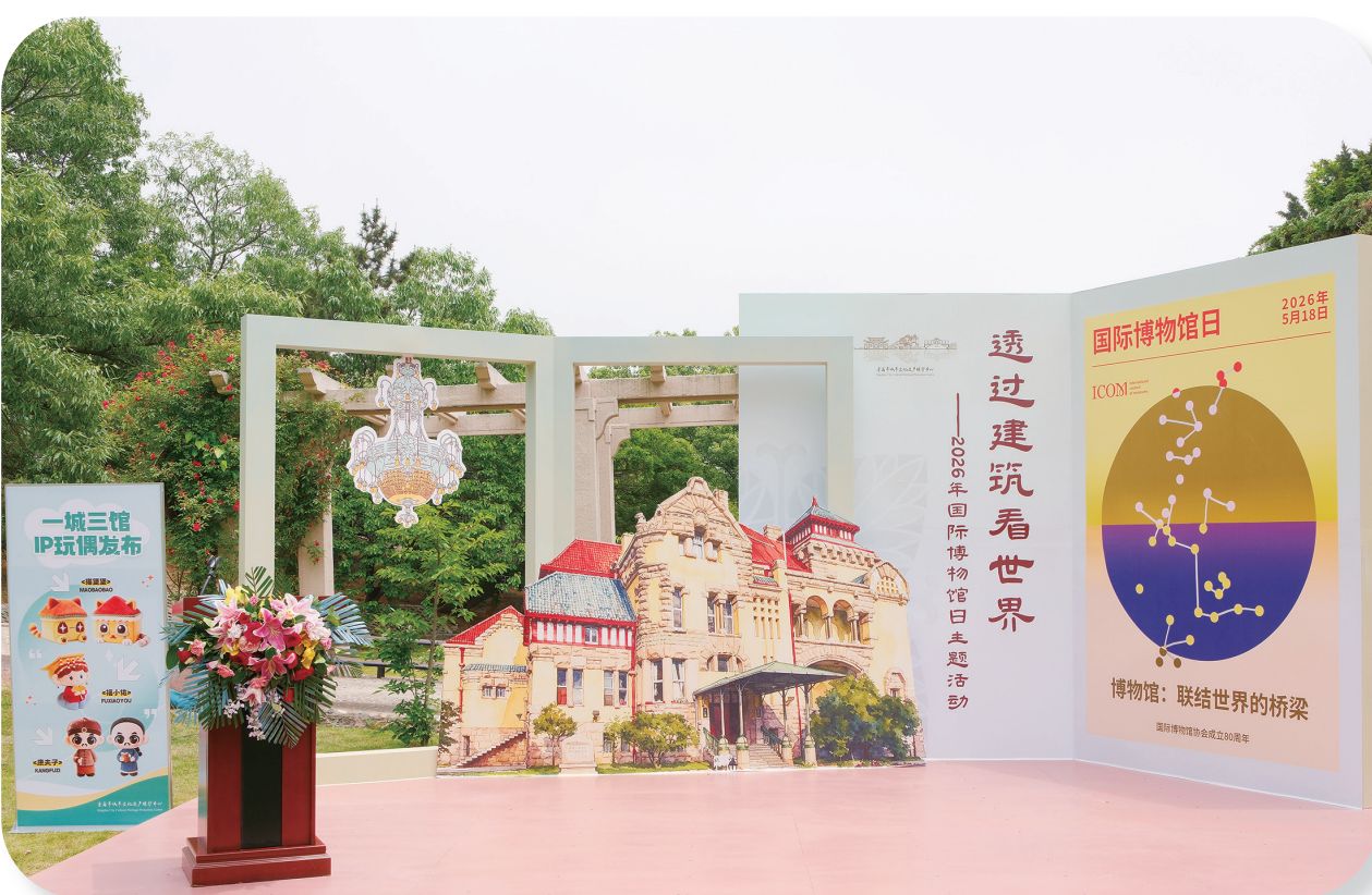
“透过建筑看世界”主场活动

让非遗传俗技艺可学可感，且兼顾残疾人等特殊群体，充分体现了文化场馆的包容性；康有为故居纪念馆的免费深度导览，带领观众感受跨文化交流的魅力，全方位提升群众的文化获得感与幸福感。中心力图打破博物馆的“围墙”，让文化变得可触可感、贴近生活，实现文化惠民与文化传承的双向赋能。