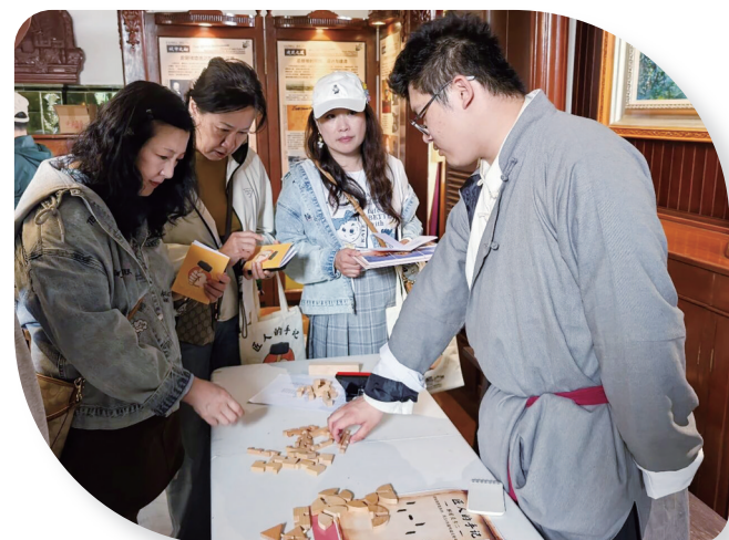
“匠人的手记”活动现场