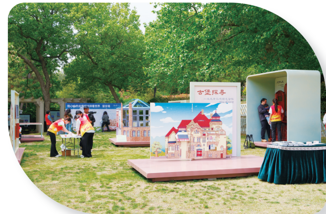
总督楼户外草坪建筑展