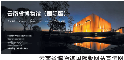
云南省博物馆国际版网站宣传图