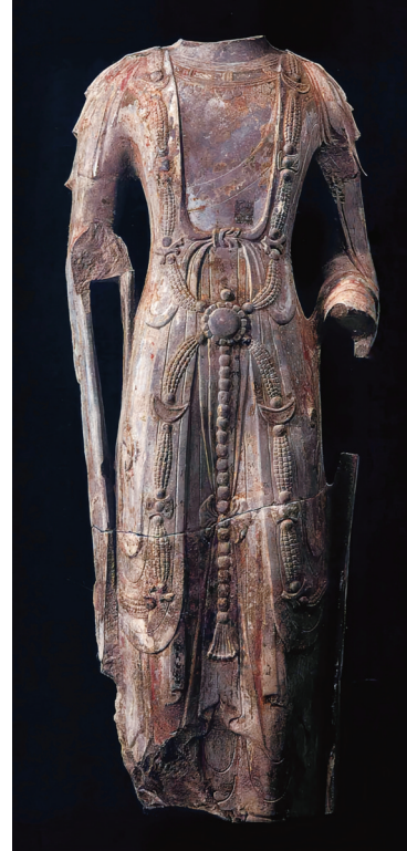
北齐菩萨立像 青州龙兴寺遗址窖藏出土 青州市博物馆藏

二是因为它特殊的行政地位：在北齐时期，诸城已升格为与青州平级的胶州州治。此前，诸城（东武县）长期隶属于青州管辖，是古青州地区的