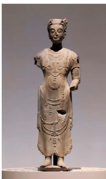
北齐菩萨像 高118厘米 诸城原城南体育馆出土 诸城博物馆藏

重要属郡。北齐皇室极度崇佛，作为胶州核心的诸城既有雄厚的财力物力支持高水准造像，又因脱离青州辖制而获得了独立发展艺术风格的自主空间。正因如此，诸城工匠才能在吸收青州主流样式的同时，大胆融入外来元素，形成独树一帜的地方风貌。