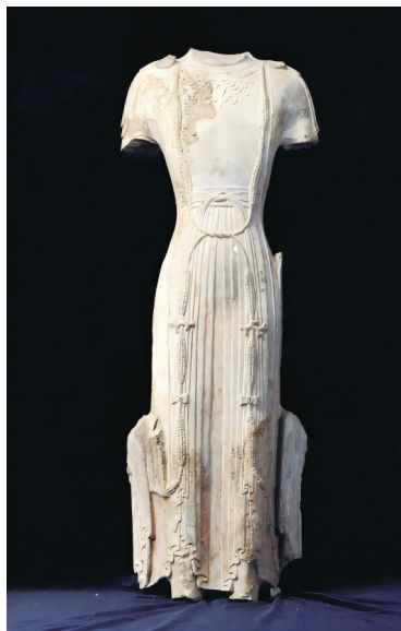
北齐菩萨立像 高77厘米 青州市博物馆藏