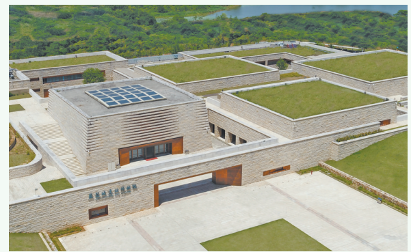
盘龙城遗址博物院