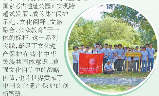
盘龙城国际田野考古暑期学校部分师生合影

盘龙城遗址的保护展示不仅为南方土遗址保护提供了标准范例，更有力支撑了中华文明探源工程与长江国家文化公园建设。从单体保护到系统集成，从静态展示到动态阐释，从学术研究到公众共享，盘龙城国家考古遗址公园正实现跨越式发展，成为集“保护示范、文化阐释、文旅融合、公众教育”于一体的标杆。这一系列实践，彰显了文化遗产保护在铸牢中华民族共同体意识、增强文化自信中的战略价值，也为世界贡献了中国文化遗产保护的创