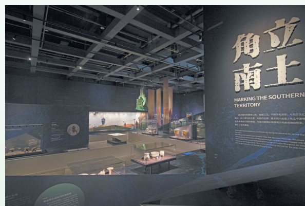
江汉泱泱 商邑煌煌——盘龙城遗址陈列

线下精品文化活动热度持续攀升，盘龙城论坛系列专家讲座定期开讲，累计开展30多期，线下座无虚席，线上直播热度居高不下；创新打造龙市市集，融合非遗与文博特色，贴合大众休闲文化需求；常态化开展公益讲解，线上云游展厅、文化五进等普惠活动，全方位满足不同群体文化需求。