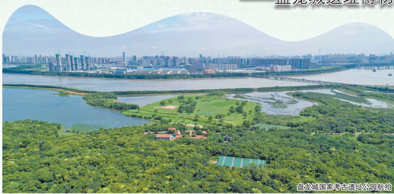
盘龙城国家考古遗址公园航拍

坐落于武汉北郊的盘龙城遗址，是璀璨的长江流域早期青铜文明中心，是滋养荆楚大地、传承千年文脉的“武汉城市之根”，更是印证中华文明多元交融、生生不息的珍贵文明坐标。3500年历史滋养，70余载考古接力，这里镌刻着武汉沧海桑田的文化记忆，承载着这座城市最初的文明底色与发展脉络，更是长江文明与黄河文明交流对话，共同融入中华文明多元一体发展洪流的生动见证。多年来，盘龙城遗址博物院始终坚持以考古学综合研究为支撑，与国内外相关单位在多学科领域开展广泛交流与合作，积极运用现代科技手段，推动盘龙城遗址性质研究、价值挖掘、科学保护和活化利用等相关工作，在遗址守护、学术深耕、展陈创新、公众服务等领域不断突破，走出一条“活态传承、融合发展”的创新之路，为新时代文化遗产保护事业贡献“盘龙城范式”。