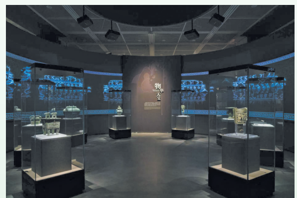
长江万里青——长江流域青铜器精品展

五版、八版责编：张 硕 何文娟 陈颖航 六版、七版责编：张 硕 陈尚宇 何文娟 五至八版版式设计：奚威威