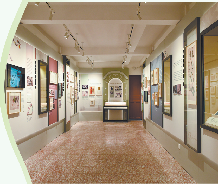
岭南艺苑旧址活化利用项目