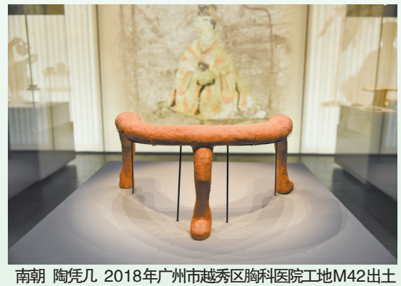
南朝 陶凭几 2018年广州市越秀区胸科医院工地M42出土

览依托姬堂晋墓及20世纪五六十年代广州晋南北朝墓葬考古资料整理成果打造,以学术研究为支撑,通过287件(套)考古出土文物,生动展现“政权分立与民族融合”时代背景下,广州在中华民族多元一体演进格局中的独特地位。