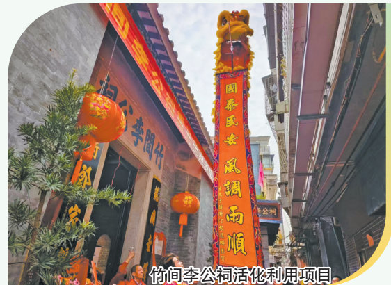
竹间李公祠活化利用项目

干预”原则,针对性整治屋面、墙体等病害,最大程度还原历史原貌;深挖其纪检监察红色历史底蕴,复原革命办公场景,打造特色廉洁教育阵地,成为党史学习教育鲜活教材。广东咨议局旧址秉持“旧址即最重要的文物展品和展示空间”的核心理念,依托旧址本体打造专题陈列展,最大限度降低对文物的干预,配套研发校园校本课程,实现革命文化教育长效落地。