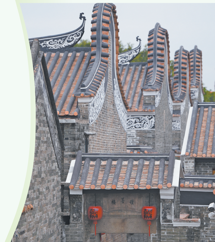
积墨楼修缮工程项目