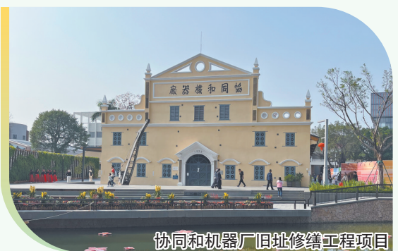
协同和机器厂旧址修缮工程项目

本次入选的四个古建筑类文物项目,通过创新保护、活化路径,成为新时代乡村文化振兴的新引擎。传统民居建筑群积墨楼引入社会资金参与修缮。练溪村霍氏大宗祠构建“政府监管+景区运营+