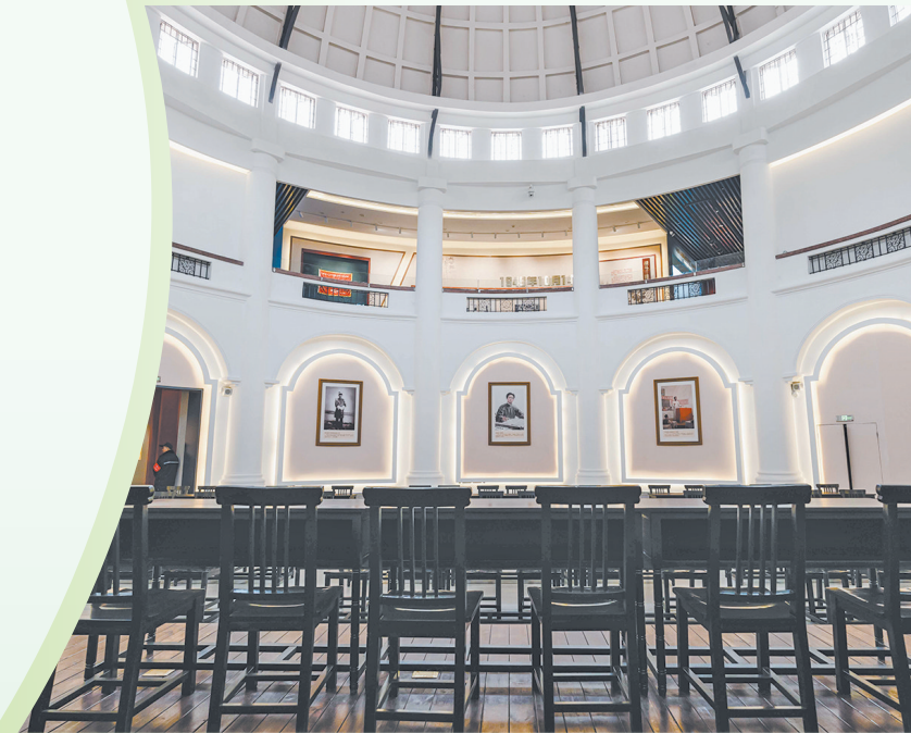
广东咨议局旧址活化利用项目