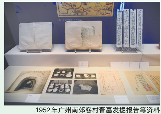
1952年广州南郊客村晋墓发掘报告等资料