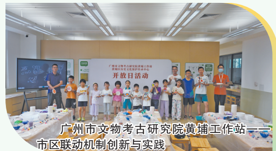
广州市文物考古研究院黄埔工作站——市区联动机制创新与实践

广州是一座具有革命传统的英雄城市,红色文物资源底蕴深厚。本次入选的两个革命文物项目,中国共产党广东区执行委员会旧址修缮坚持“最少