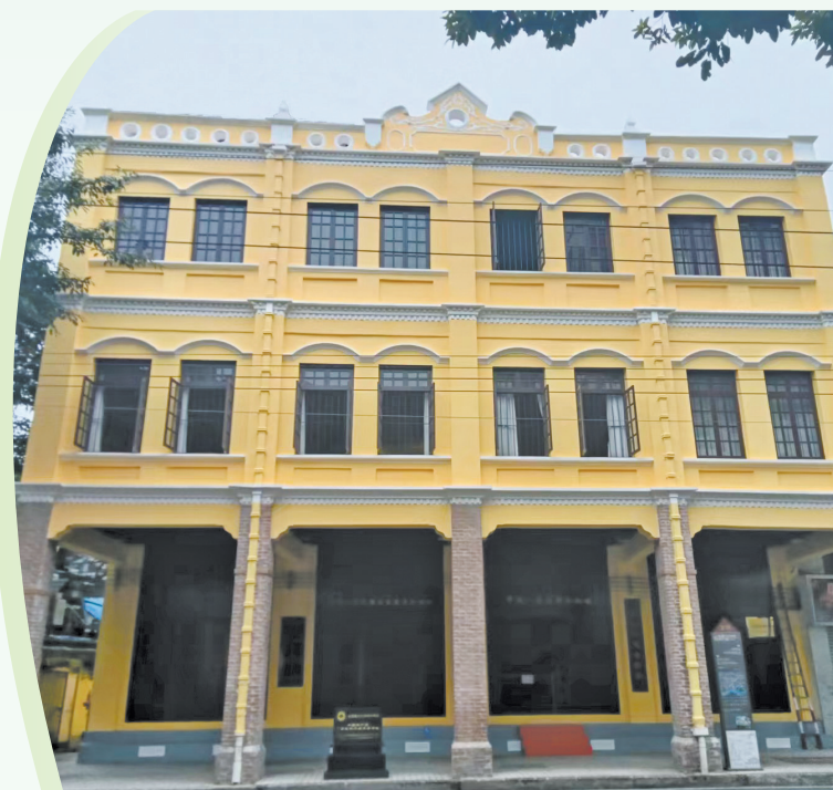
中国共产党广东区执行委员会旧址修缮与活化利用项目