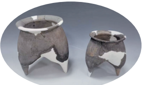
正威集团5G新材料项目出土商代陶器

2023年7月至2024年12月，吉林大学在轅村遗址南部发掘3000平方米，发现有仰韶中晚期、夏至早商时期、商周之际及战国时期的房址、灰坑、窑址和墓葬等。其中，仰韶中期以灰坑为主，还有部分房址、墓葬和窑址，出土有盆、罐、钵、小口尖底瓶、葫芦口瓶、骨簪、骨锥、石斧、石陀螺形器等；仰韶晚期仅有陶窑和一道墙体。夏商周时期遗存以灰坑和房址为主，早商时期有中小型墓葬，出土器物有鬲、罐、尊、盆、豆、甗等，其他遗物有青铜器、骨器、玉器。其中发现的商周之际刻有“亚生”“戈”族徽的陶片为研究晋南地区商周时期遗存提供了十分重要的实物资料。