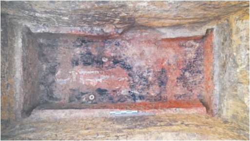
野山坡墓地B区M114椁室全景

第二类为中型墓。形制为带长斜坡墓道的甲字形竖穴土坑墓与无墓道的长方形竖穴土坑墓。墓口长度4米~7米，深度2.8米~4.5米。分布无规律，墓葬朝向不一。随葬有仿铜陶礼器、兵器、骨角器。