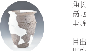
亚新科汽车零部件制造基地项目出土仰韶晚期陶罐