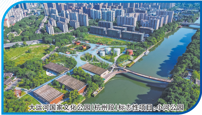
大运河国家文化公园(杭州段)标志性项目:小河公园