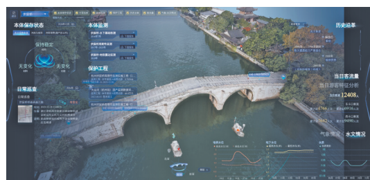
“数智运河”监测预警平台

顶层设计统筹联动,织密遗产保护制度防线。杭州立足城市发展全局,持续完善大运河保护顶层架构,依托杭州市历史文化名城和世界文化遗产保护委员会建立大运河文化保护传承利用专项议事机制,常态化召开工作推进会、闭环落实上级各项工作部署与指示要求,2025年度16项重点督办任务全部按期高质量办结;同时,将大运河保护全面融入全市国民经济发展规划、文物事业专项规划,启动大运河保护条例法治调研与保护规划修编工作,持续完善遗产评估、项目管控、日常巡查全链条标准体系;针对运河沿线六大城区,全市统一建立文保区划建设项目协同审批机制,将遗产保护要求前置融入国土空间规划、项目审批、后期监管全流程,从源头规避建设开发对运河遗存的破坏。目前,桥西、大兜路、塘栖、西兴四大运河沿线历史风貌区保护规划全部落地实施,实现遗产本体、历史街区、滨水风貌一体化管控。数据显示,2025年杭州为运河遗产保护区划内82个建设项目出具遗产影响评价,