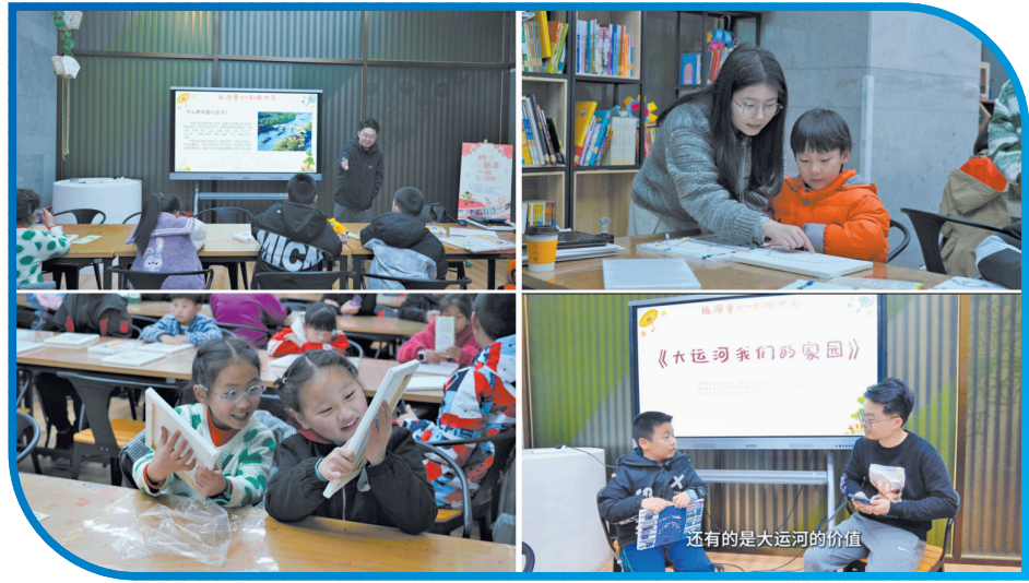
“运河童心·彩绘拱宸”大运河文化研学活动