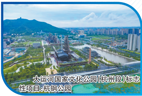
大运河国家文化公园(杭州段)标志性项目:杭钢公园