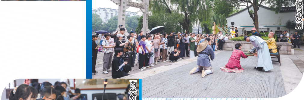
塘栖古镇实景快闪戏剧