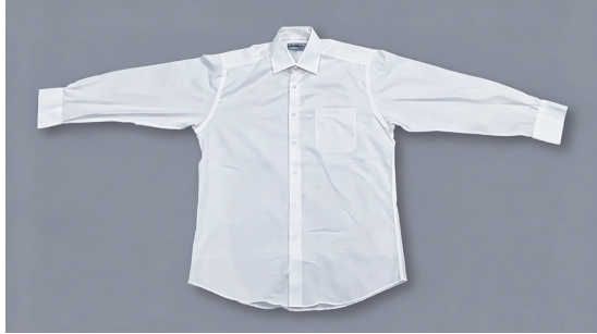
袁隆平获“共和国勋章”时所穿衬衫(一级文物)