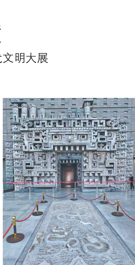
入口装置复刻玛雅神庙的经典建筑元素

[本文系2024年度国家社科基金文化遗产保护传承专项课题“建立健全文化遗产督察制度研究”(项目编号:24VWB011)阶段性成果。作者单位:兰州理工大学法学院文化遗产法研究所]