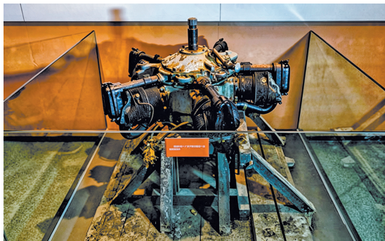
1954年株洲国营三三一厂生产的我国自主研发的第一批航空发动机(一级文物)

全省各级各类博物馆陆续收藏了一批兼具历史价值、时代特征与湖湘标识的代表性物证,全方位展现湖南现代化建设的奋进华章。