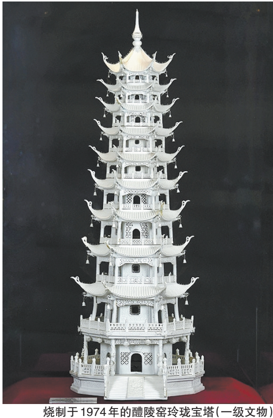
烧制于1974年的醴陵窑玲珑宝塔(一级文物)