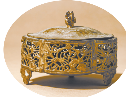
博物馆藏黎家槟榔盒 海南省乐东黎族自治县

地理上，海南扼守南海航道咽喉，正如宋人楼钥所说，往来的海船“势须至此少休息，乘风往集番禺东”，海南是商船从南洋驶向中国大陆的必经之地和中转枢纽。南宋乾道年间（1165—1173），广州市舶司专门奏请在琼州设市舶机构，负责从南洋返回船舶的检查，防止商船偷漏税，足见当时经过海南的贸易流量之巨。