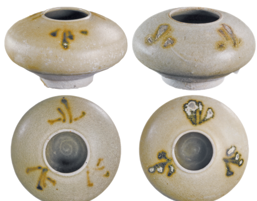
“黑石号”出水长沙窑青釉褐绿彩水盂

1998年印尼勿里洞黑石号沉船的发现，出水了大量中国陶瓷器，其中以长沙窑瓷器为大宗，共56500多件。这些长沙窑瓷器中，碗的数目最多，约5万件，其次是壶类，其他还有罐、盘、瓶、水盂、油灯、熏炉、油盒、碟、盘、瓷塑等各种类型的产品。2017年，长沙铜官窑遗址管理处成功从海外征集到一批黑石号沉船长沙窑瓷器，共162件（套），其中包括长沙窑水盂13件，这组水盂造型小巧精致、规格相近，应为统一烧制，专供外销的器物。本文拟对这13件水盂的形制特征、传统功用及外销后的功能转变进行初步探讨。